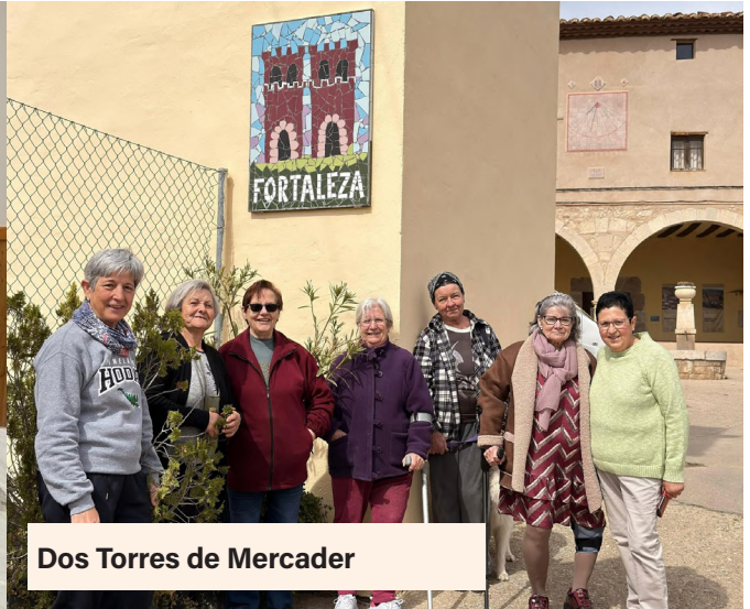
Dos Torres de Mercader