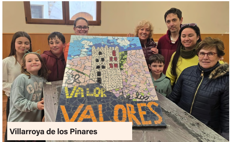
Villarroya de los Pinares

Con esta iniciativa, la Comarca reafirma su compromiso con la igualdad y con la dinamización cultural del territorio a través de proyectos participativos que conectan arte, identidad y comunidad.