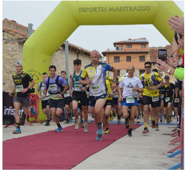
I Trail Territorio Fortanete

Desde la organización, por parte de Deportes Maestrazgo y los Ayuntamientos de Fortanete y Villarroya, se ha querido agradecer la implicación de voluntarios, entidades y participantes, fundamentales para el éxito de estas pruebas.