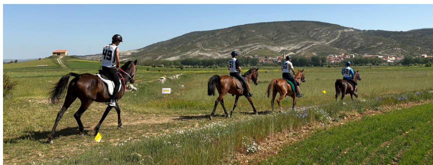
Foto de la primera edición del Raid en 2025

Fortanete ya ultima los preparativos para la celebración del II Raid, que tendrá lugar el próximo 13 de junio. Tras el éxito de la primera edición, en la que participaron 11 equipos procedentes de todo el país, la organización trabaja para consolidar esta cita como un evento destacado dentro del calendario deportivo y social del municipio.