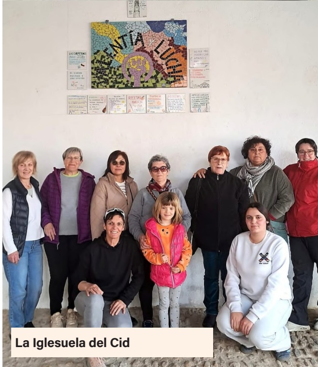
La Iglesuela del Cid