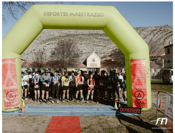
IX Trail Villarroya de los Pinares