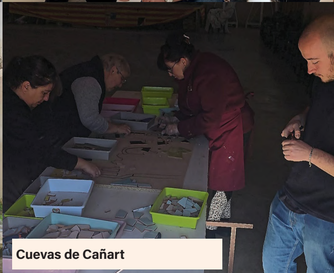
Cuevas de Cañart