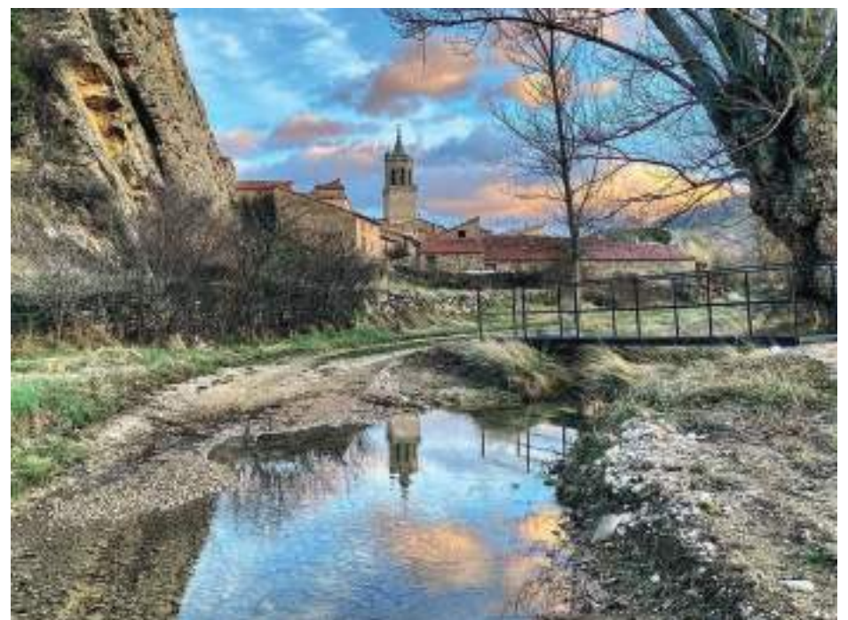
Miravete de la Sierra

El perfil pone en valor, a través de bonitas fotografías, todos los atractivos turísticos que ofrece Miravete en cualquier época del año. La cuenta se abrió en abril del 2019, justo cuando estallaba la revuelta de la España Vacía. Cuenta ya con casi 300 publicaciones dedicadas al pequeño municipio y con 1950 seguidores, enamorados de las bonitas estampas que se publican de Miravete.