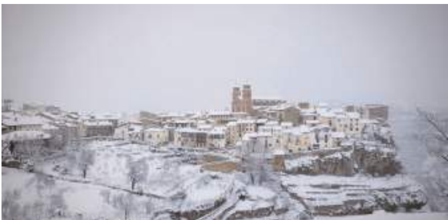
Villarluengo cubierto por un manto blanco.

En los primeros días del año la borrasca Filomena cubrió por completo la comarca del Maestrazgo, dejando bajo un manto blanco todos sus municipios durante unos días.