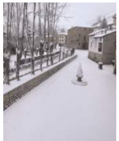
Villarroya de los Pinares

MAESTRAZGO INFORMACIÓN ES UN PERIÓDICO COMARCAL GRATUITO. SU CONTINUIDAD ES POSIBLE GRACIAS AL ESFUERZO COMPARTIDO DE LA COMARCA DEL MAESTRAZGO, LA ASOCIACIÓN PARA EL DESARROLLO DEL MAESTRAZGO Y EL TRABAJO DE LAS CORRESPONSALES QUE RECOPIAN LAS NOTICIAS. TAMBIÉN PUEDES AYUDAR RECIBIENDO LOS SEIS NÚMEROS ANUALES EN TU CASA POR SOLO 10 EUROS (incluye gastos de envío y gastos de cobro bancarios) SI ESTAS INTERESADO EN HACERTE SUScriptor O ANUNCIANTE DEL PERIÓDICO, CONTACTA CON NOSOTROS EN EL 978849709 O EMAIL periodico@maestrazgo.org