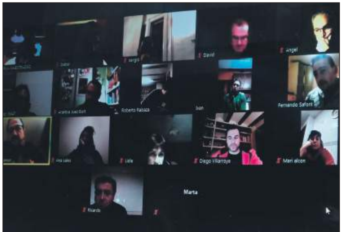
Consejo Comarcal durante la aprobación de presupuestos.

Además, se aprobaron diferentes bolsas de trabajo para cubrir puestos en la institución.