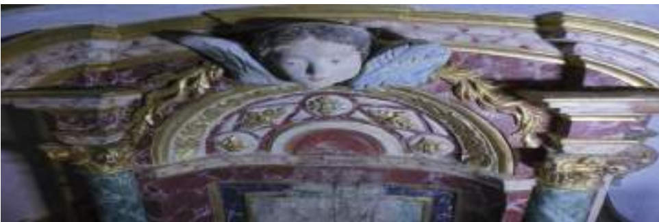
Altar de la virgen del Tremedal de Tronchón antes de la restauración

Además del nuevo libro adquirido, en el Museo pueden encontrarse otras piezas originales de gran valor, como grabados, ilustraciones, prensa de la época, libros... El Museo de Cantavieja se contempla como un centro de documentación importante sobre las guerras carlistas del s. XIX a su paso por el Maestrazgo.