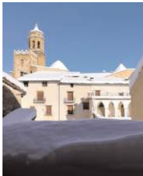
La Iglesuela del Cid