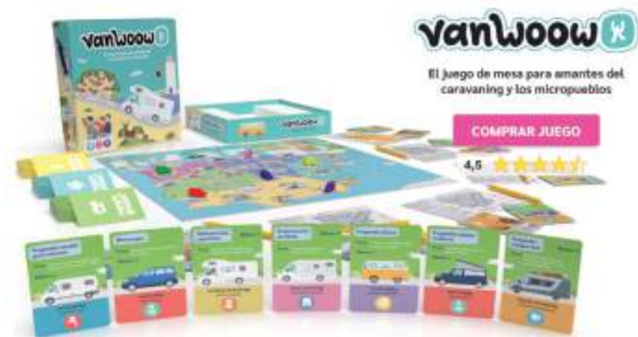
VanWoow, el juego de mesa para amantes del caravanning y los micropueblos