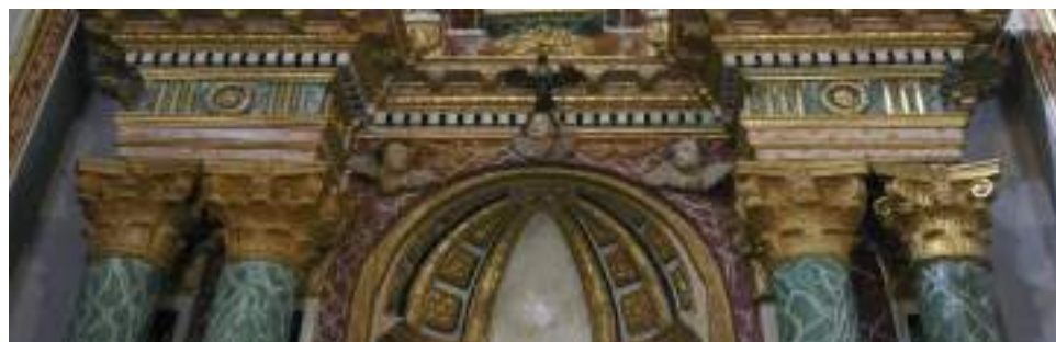
Altar de la virgen del Tremedal de Tronchón después de la restauración

EL PROGRAMA TELEVISIVO "UNA HISTORIA, UNA CANCIÓN" DE MOVISTAR+ HABLA SOBRE LA LOCALIDAD DE CUEVAS