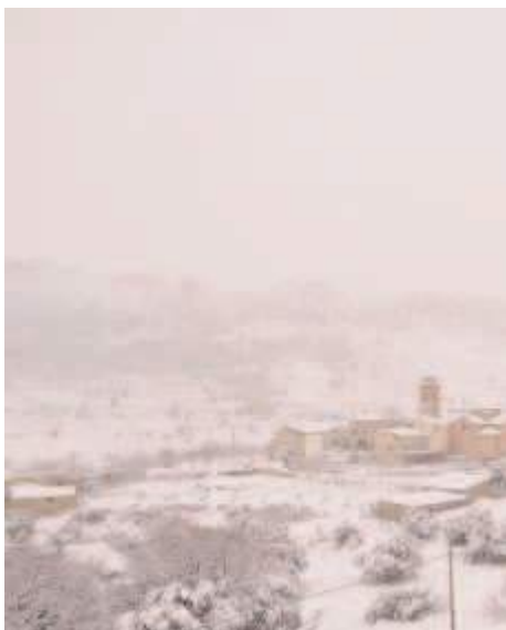
Dos Torres de Mercader