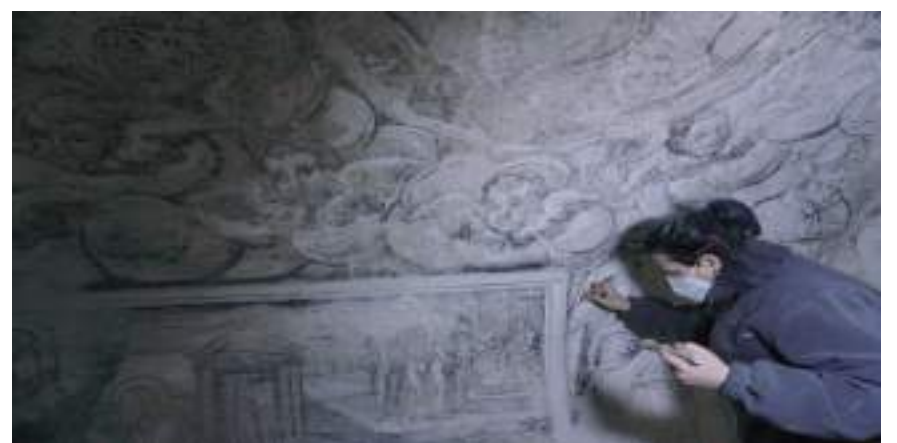
Restauración de Grisallas del Calvario de Bordón

Diferentes municipios comarcales reciben actuaciones de restauración y conservación de su patrimonio, recuperando así una parte histórica importante para los vecinos.