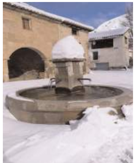
Miravete de la Sierra