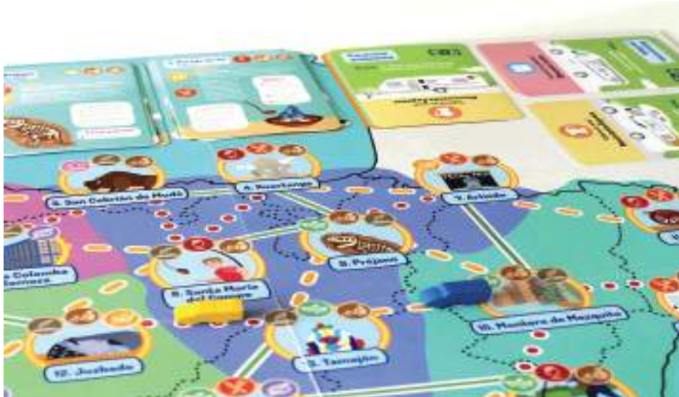
Montoro de Mezquita casilla de VanWoow.

VanWoow es un proyecto social y colaborativo de turismo local, responsable y sostenible. Su objetivo es luchar contra la despoblación rural de España, visibilizando los micropueblos y todas las actividades que estos ofrecen, incitando a la población a visitarlos.