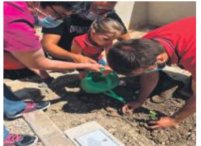
El Alcalde de Tronchón junto con los vecinos.