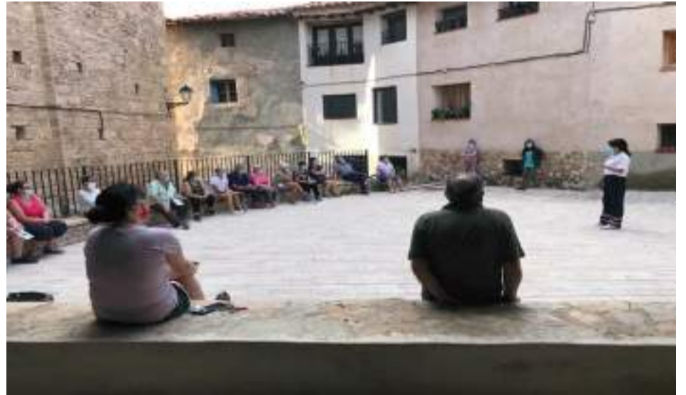
Los vecinos de Cuevas de Cañart asisten a la reunión informativa.

y ser ejemplo para las personas que acuden este verano a la zona. Además aprovecharon para dar consejos sobre el uso de mascarillas y guantes. Aseguraron que una vez se supere la pandemia y se vuelva a la normalidad se restablecerá el servicio en todos los municipios tal y como estaba hasta ahora.