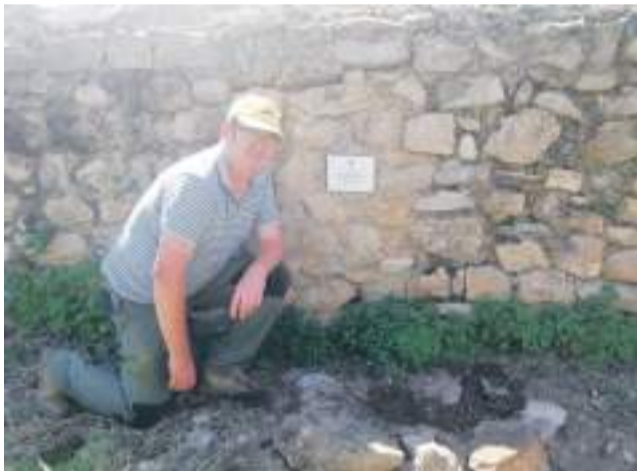
Bordón plantó la carrasca de homenaje.