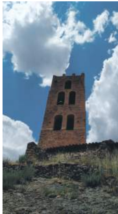
Torre Villarroya de los Pinares

El Ayuntamiento de Villarroya se halla inmerso en unas obras financiadas por fondos de FITE del 2018.