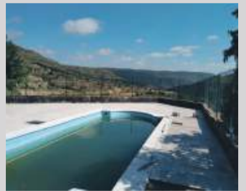
Piscina La Cuba

De esta manera, a pesar de no abrir la este verano, La Cuba contará por fin con una piscina infantil y otra para adultos bien adecuadas para el ocio y disfrute de todos los vecinos.