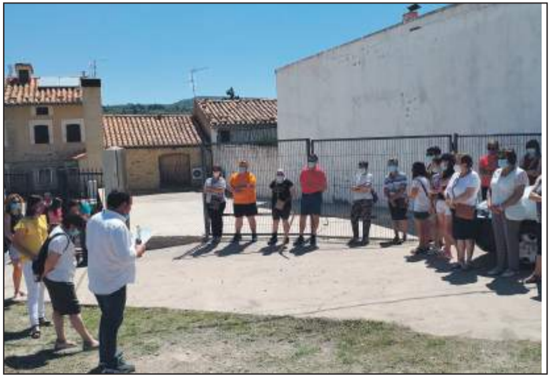
Lectura manifiesto homenaje en Cantavieja.

Los municipios se reinventan para que afrontar el verano.