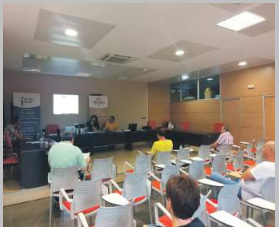
Junta de ADEMA celebrada en Cantavieja el pasado 22 de Junio.

Para consultar la web, es muy sencillo accede en el buscador e introduce www.maestrazgo.org ahí la home principal con un lenguaje sencillo e intuitivo permite acceder a toda la información necesaria.