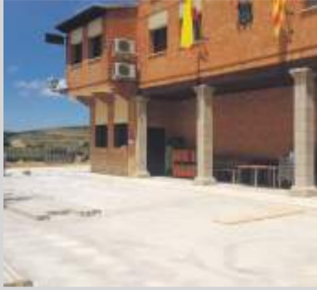
Acceso espacios públicos.

El Ayuntamiento de la Cañada de Benantanduz está trabajando en la mejora de todo el perímetro de la zona con más vida del pueblo. Se trata del espacio donde se ubica el Ayuntamiento, el bar, la farmacia y el consultorio médico.