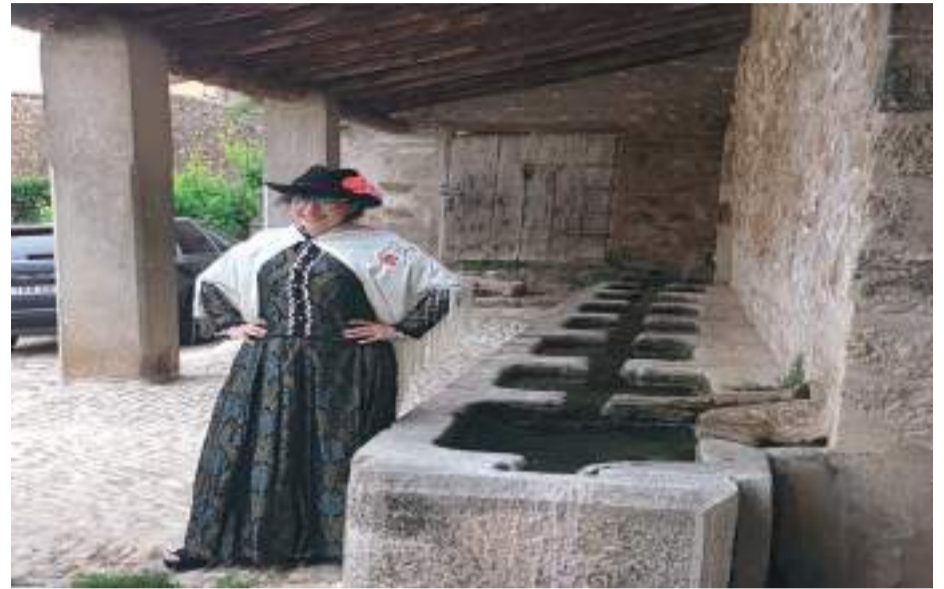
La quinta de Villarluengo se vistió con su traje para el Baile del Reinao

Poco a poco se va normalizando la situación en los municipios de la Comarca con el desconfinamiento pero aún no se pueden celebrar fiestas y eventos tal y como lo hemos hecho hasta ahora. Esto no ha impedido que en algunas localidades hayan querido hacer un guiño a estas celebraciones realizando pequeños actos que las recuerden.