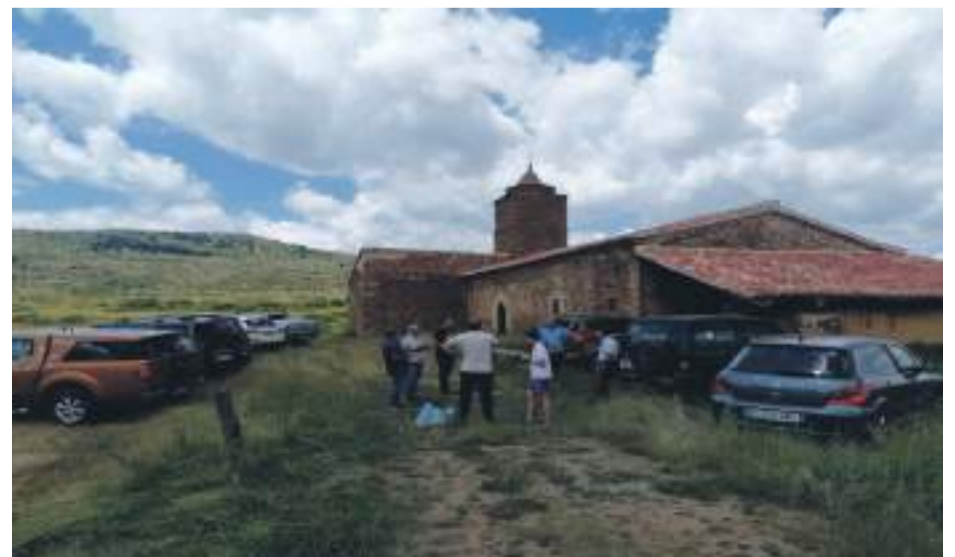
Vecinos de Allepuz celebrando una atípica romería de Santa Isabel.

A pesar de las limitaciones, una cincuenta de vecinos se ha desplazado hasta el ermitorio para pasar un día diferente, andar los 12km hasta Santa Isabel y celebrar la misa. Un rayo de luz tras el confinamiento de varios meses y la suspensión de tantos actos programados.