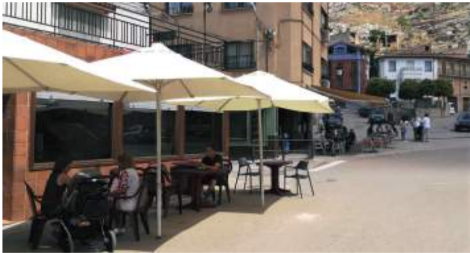
Reapertura de establecimientos en la Comarca

Algunas Oficinas de Turismo como la de Villarlúengo o Tronchón no abrirán sus puertas este verano, el resto están en funcionamiento desde el 1 de julio. Abierto está también el Torreón Templario en Castellote así como la sede de Dinópolis Bosque Pétreo desde el día 6 de julio.