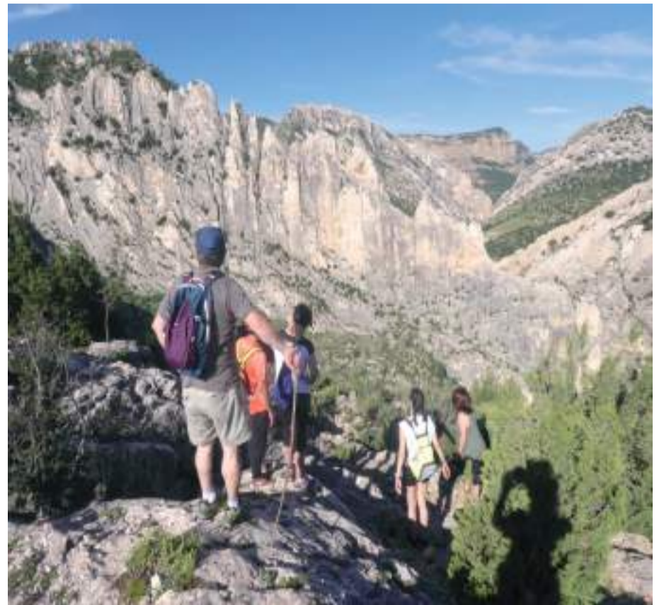
Turistas en el mirador de Valloré tras la salida del confinamiento.

El turismo de naturaleza, y pequeñas rutas de senderismo el mayor reclamo tras el comienzo de la desescalada.