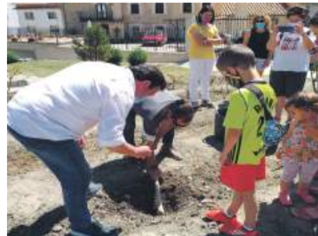
Cantavieja rindió homenaje a las víctimas