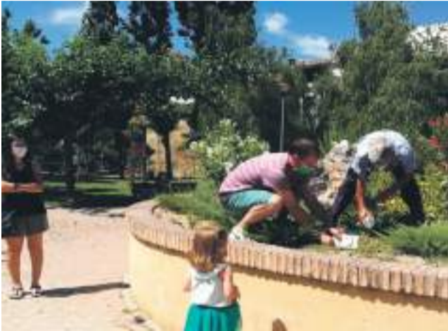
Castellote homenaje a las víctimas del COVID-19.

Este acto es una muestra de unión entre todos los pueblos de la comarca del Maestrazgo, y ejemplo de solidaridad por las víctimas de la pandemia y agradecimiento a todos los profesionales que han puesto todo su esfuerzo y dedicación al servicio de la ciudadanía.