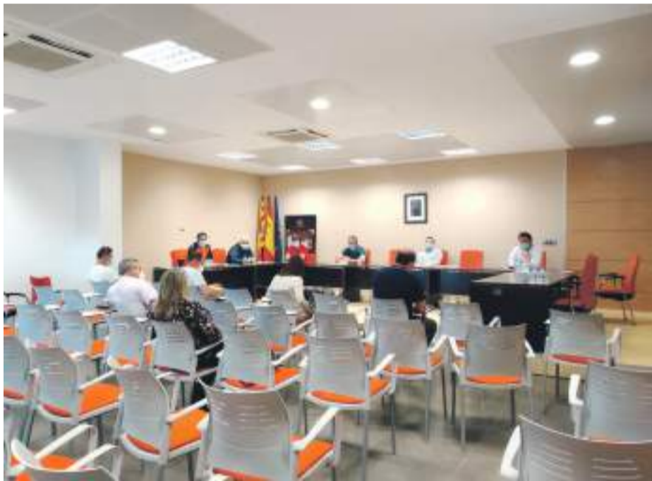
Reunión de los Alcaldes del Maestrazgo en la sede Comarcal.

En relación a este último aspecto, se instó a que los municipios trasladen los posibles nuevos senderos locales a marcar, así como la posibilidad de unirlos todos a través de un GR.