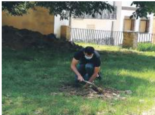
La Iglesuela rindió homenaje con los mayores.