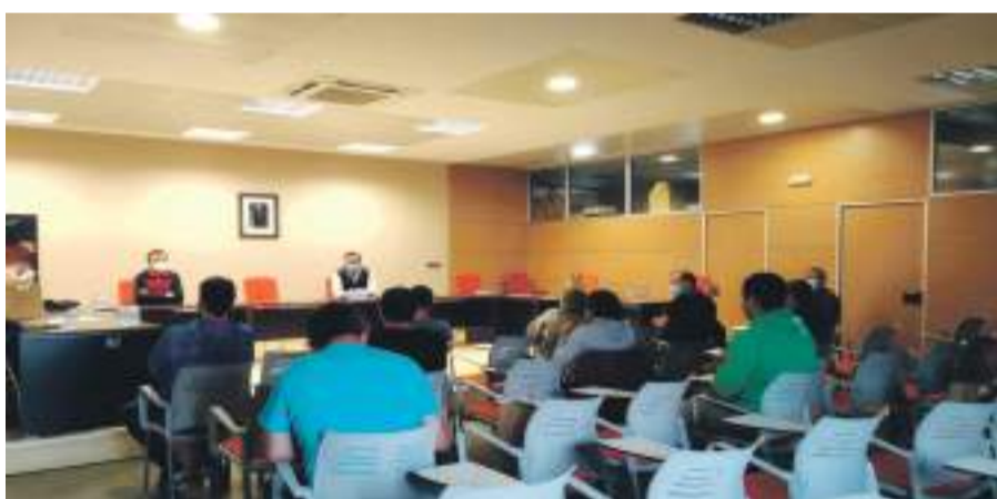
Los alcaldes de la Comarca del Maestrazgo reunidos en consejo.

Los alcaldes del Maestrazgo se reúnen para tratar varios temas sobre la temporada de verano, temas destacados como la suspensión de fiestas patronales, apertura de piscinas, apoyo apertura Oficinas de turismo entre otros de los temas principales tratados.