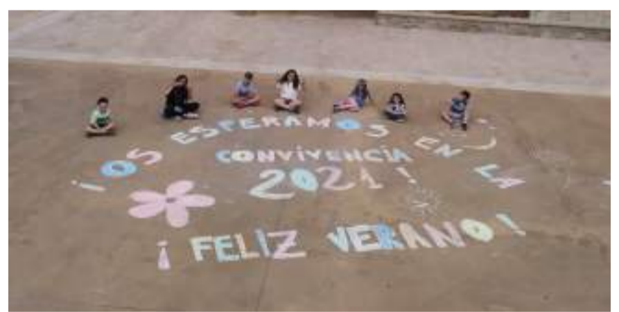
Alumnos del colegio de Bordón en el final de curso 2019-2020

El curso escolar 2019-2020 llegó a su fin en todos los ámbitos de una manera diferente. La educación de adultos ya se preparará para el nuevo curso con la matriculación de alumnos de Educación Secundaria.