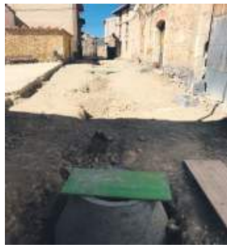
Obra Calle Cantavieja

durante el mes de septiembre. Con esta actuación se dará por completado el circuito de todo el casco histórico de Cantavieja.