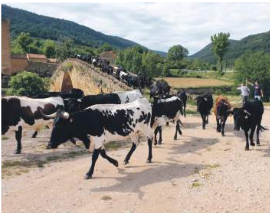
Vacas trashumantes a su paso hacia el Maestrazgo.

La trashumancia es una tradición secular que se mantiene viva gracias a los ganaderos del Maestrazgo turolense que siguen realizando a pie este recorrido que han heredado de sus antepasados.