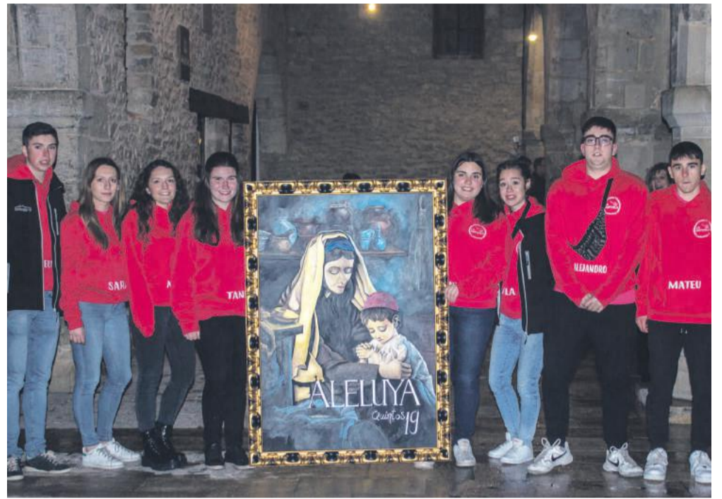
Los quintos de Cantavieja "plantan la Aleluya" el sábado de Pascua.

En Cuevas de Cañart tuvo lugar la "San Viernes Fest". El Jueves Santo se organizó una fiesta inspirada en los años 80 y 90 y el viernes hubo cena, bingo y más fiesta.