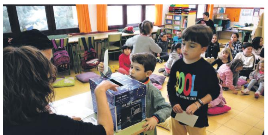
Niños Colegio de Castellote participan en una simulación electoral.

El Europe Direct CAIRE ha organizado varias actividades con motivo del Día de Europa. Se ha organizado una simulación de elecciones europeas con partidos ficticios y se han celebrado jornadas de Diálogos Ciudadanos en Cantavieja y Teruel.