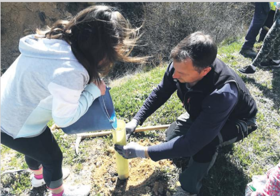
Plantación de 100 carrascas cerca del pabellón del pueblo de Bordón.

Está previsto que cada año, se dedique lo recaudado en una acción similar que redunde en la mejora del entorno.