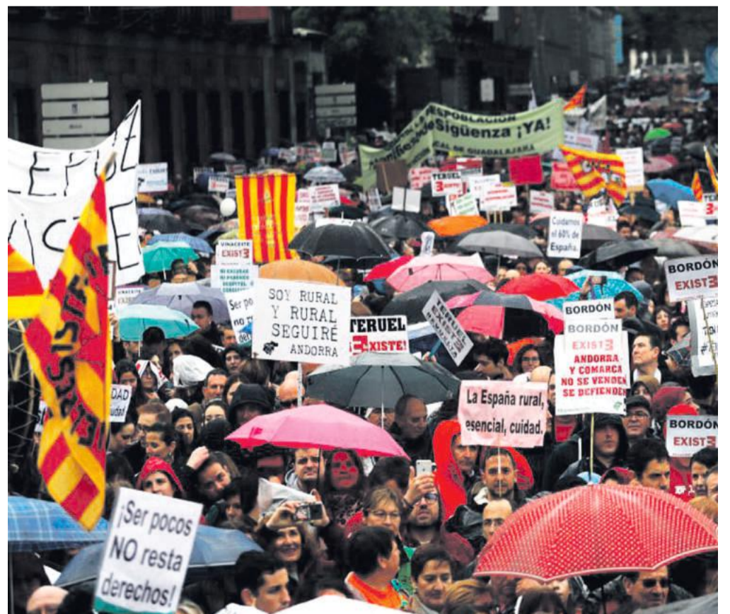
Pancartas alusivas a varios pueblos del Maestrazgo en la manifestación 31M.

Sin duda una jornada histórica que ojalá tenga repercusión en los programas de gobierno.