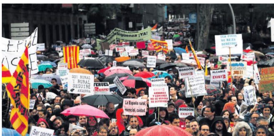
Varias pancartas y carteles alusivos a pueblos del Maestrazgo en Madrid.

Procedentes del Maestrazgo se pudieron ver diferentes pancartas y carteles de personas procedentes de Castellote, Allepuz, Cantavieja, Las Cuevas de Cañart, Bordón, Dos Torres de Mercader, Villarluengo, Montoro y Pitarque, que se unieron al sentir y la reivindicación de todos en el 31M.