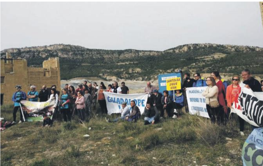
Marcha del Ebro en Santolea.

Santolea y por otro, los daños causados en el Guadalupe tras el comienzo de las obras de ampliación del embalse, que como consecuencia de un vaciado sin la suficiente previsión, habían ocasionado graves afecciones consecuencia del vertido incontrolado de lodos al río. La etapa que dio comienzo en Caminreal, llegó a Santolea pasando por Molinos. Allí, medio centenar de personas se reunieron, tanto ciclistas como simpatizantes de la causa, donde se pudo escuchar un manifiesto por cada una de las entidades convocantes. La marcha siguió después por la vieja carretera hasta llegar a la presa principal, donde hicieron una breve parada para después continuar hacia Castellote, Abenfigo y finalizar en Aguaviva. En esta localidad se realizó una obra de teatro con marionetas titulada "Hubo un pueblo", que recordó al público asistente lo sucedido hace algunas décadas en Santolea.