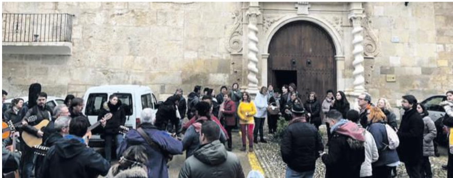
Ronda en las calles de Castellote.

Esta tradición se celebra año tras año el sábado de Pascua. Antiguamente la Aleluya la colgaban los mozos a los que ese año les tocaba hacer la mili y pintaban a la Virgen para pedirle protección. Aunque esto ya quedó olvidado, los jóvenes de diecinueve años continúan con esta bonita tradición.