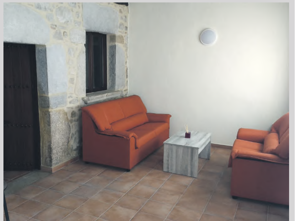
Interior de la nueva sala de duelos instalada en Fortanete.

dentro del mismo edificio. Esta parte, es mucho más atractiva ya que en una de las paredes se encuentra el antiguo horno de la localidad, pudiéndose ver las diferentes puertas del mismo. Se ha habilitado la estancia con una barra, una estufa de pellets y se ha decorado con antiguas fotografías de la localidad, de lo cual se ha encargado la Asociación Cultural, por lo que resulta un local mucho más acogedor y cálido que el de antes. Está previsto habilitar próximamente, en la antigua zona del bar, la sala que hará de comedor. Estas actuaciones se han podido llevar a cabo gracias al Fondo de Inversiones Municipales Financieramente Sostenibles de Diputación de Teruel. El establecimiento está ubicado en la planta baja de un edificio de varios pisos propiedad del consistorio donde hay habilitado en la parte superior un salón multiusos y en el piso intermedio está previsto acometer obras para que también pueda ser empleado por los vecinos.