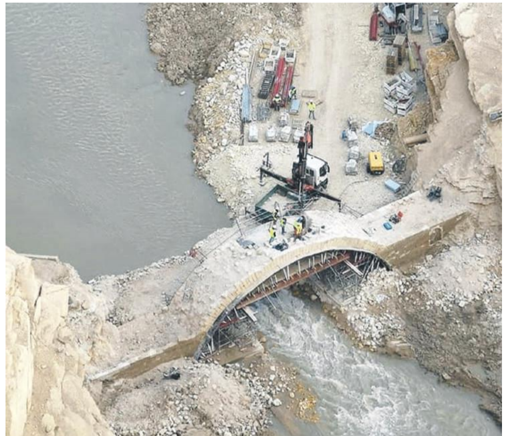
Desmontaje del puente (foto: Salvemos el antiguo puente de Santolea).

EL 13 DE ABRIL TUVO LUGAR EL ENCUENTRO, ACOMPAÑADO DÍAS ANTES POR ACTUACIÓN GRUPO VOCAL "SANTOLEA"