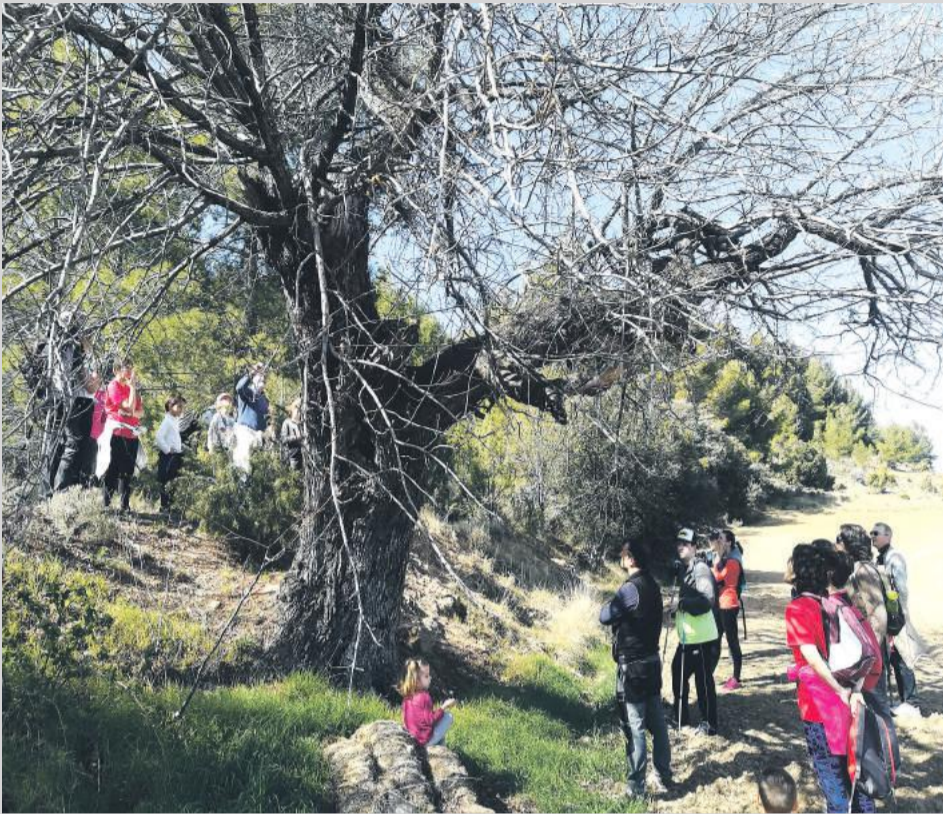
Excursión al "azarollo" o serbal, árbol monumental del Maestrazgo.

Tras algo más de un año desde que se puso en marcha la campaña "Compensa tus emisiones de CO2 en el Maestrazgo" promovida desde la Asociación de Empresarios Turísticos, el 23 de marzo se celebró en Bordón el acto de compensación derivado de la misma, donde los donativos de turistas y establecimientos se revirtieron en un acto dedicado a conservar y proteger el entorno natural de la Comarca.