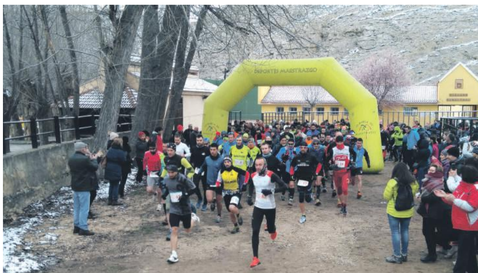
Momento de la salida de la prueba en Villarroya de los Pinares.

La tarde del sábado se disputó la versión infantil del Trail, siendo los más pequeños los que midieron sus fuerzas en la carrera en diferentes categorías con alta participación. Este cross se integra en la cuarta edición del circuito de Carreras Infantiles que el Servicio Comarcal de Deportes ha preparado con el objetivo de fomentar el deporte entre los más jóvenes.