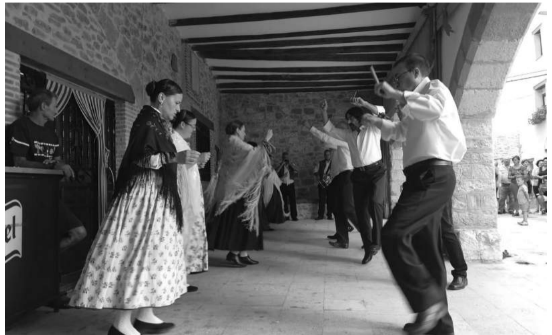
Seis parejas se atrevieron a recuperar el baile de "Las Vueltas" en fiestas de agosto.

Los vecinos de La Cuba este año han alcanzado un objetivo largamente esperado: recuperar el antiguo baile de "Las Vueltas", baile que era característico del pueblo y que se dejó de bailar hace alrededor de 50 años. Un grupo de personas se juntó en primavera gracias al empeño del Área de Patrimonio de la Comarca del Maestrazgo y de la etnóloga Carolina Ibor. Tras pocos ensayos aprendieron los pasos que los mayores recordaban y que Ibor había recogido en su trabajo de investigación publicado junto a Diego Escolano en el año 2003 "El Maestrazgo Turolense. Música y literatura populares en la primera mitad del siglo XX". Además, incluso les enviaba los pasos por video whatsapp y las melodías a modo de "deberes" para que fueran practicando. También las mujeres más mayores del pueblo que aún lo bailaron les dieron alguna indicación al respecto.