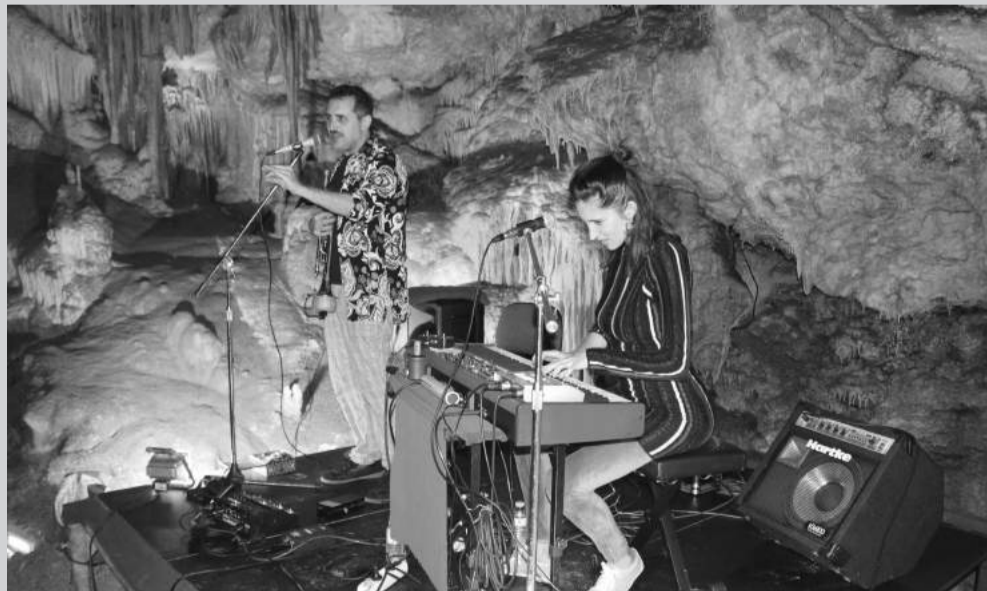
Actuación de "Versonautas" en las Grutas de Cristal de Molinos.

El festival Música y Palabra de Molinos sin duda volvió a sorprender con sus propuestas, dejando claro un año más su vocación de ofrecer una programación variada y bien estructurada que abarca distintos estilos musicales, formaciones diversas, etc. manteniendo una singular atención a la palabra, hilo conductor del ciclo de manera implícita o manifiesta.