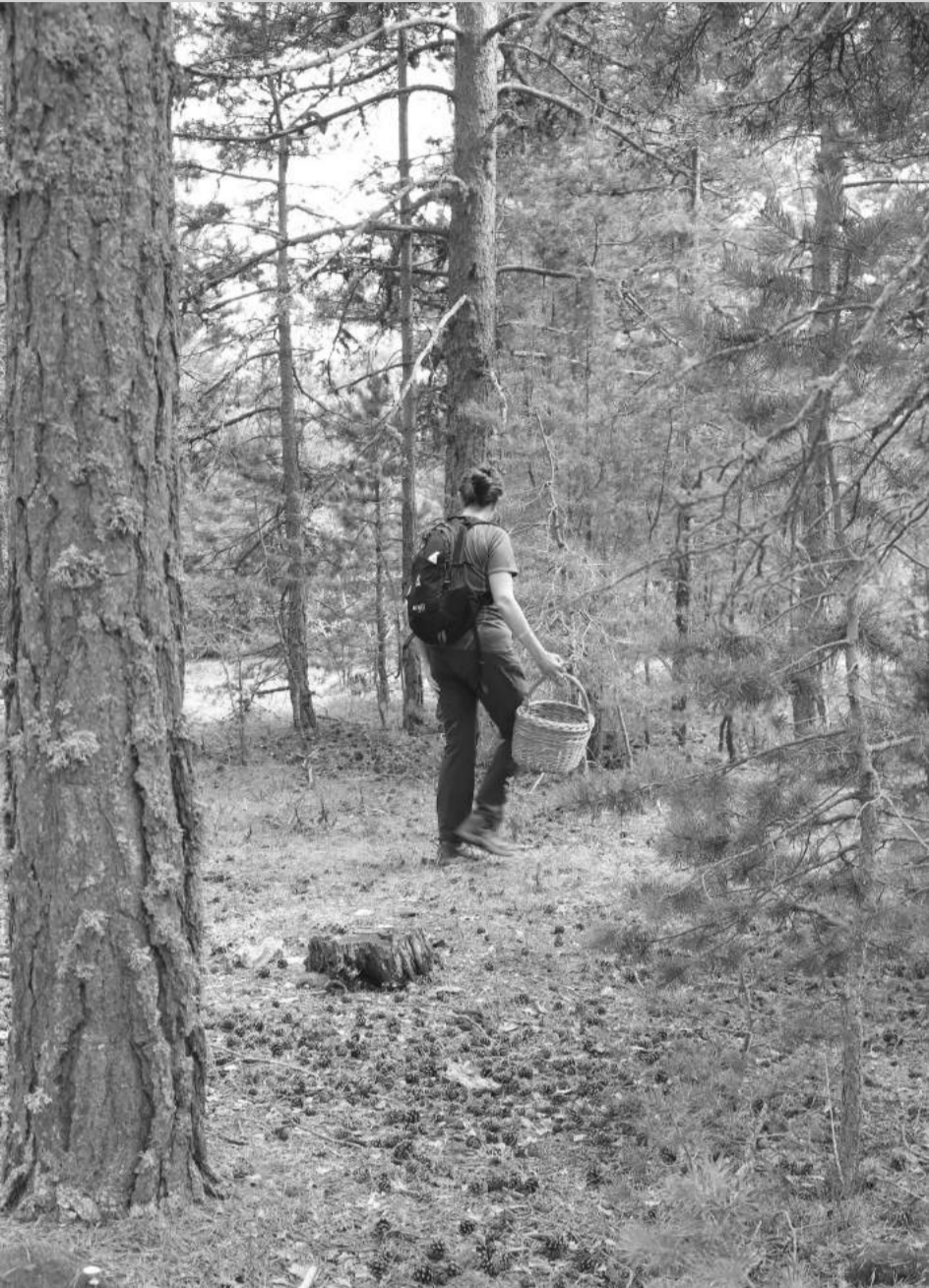
Orquídea del grupo Ophryx (izquierda) y Neotinea Ustulata (derecha).

Los amantes de la micología del Maestrazgo este año vuelven a disfrutar de una de sus aficiones. Después de cuatro años de sequía, el monte ha sido bendecido con la deseada lluvia y ha hecho brotar el deseado rebollón y otras especies micológicas que tanto atraen a propios y foranos. Desde la Institución Comarcal califican la campaña de "excepcional". Gracias a una climatología propicia, septiembre ha sido un mes de gran afluencia de visitantes. El coto micológico del Maestrazgo tiene una extensión de 10.500 hectáreas distribuidas por varios municipios. A finales de septiembre se habían vendido alrededor de 13.000 pases y, si en octubre volviese a llover se esperaba que esta temporada fuese de "récord" y superase los 19.000 que se vendieron en 2014.