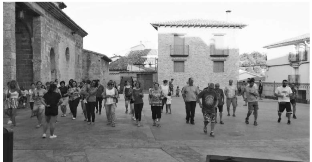
Taller de bailes latinos en Bordón (Foto: Jordi Soler).