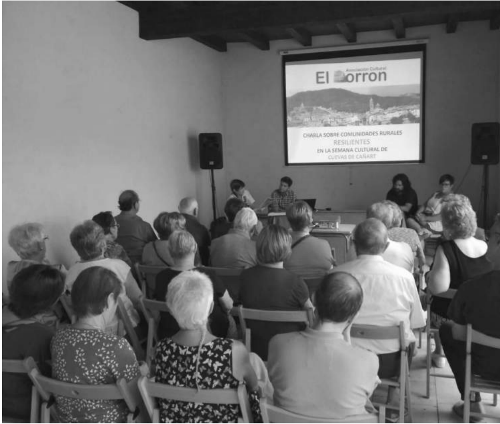
Charla sobre despoblación en Cuevas de Cañart.