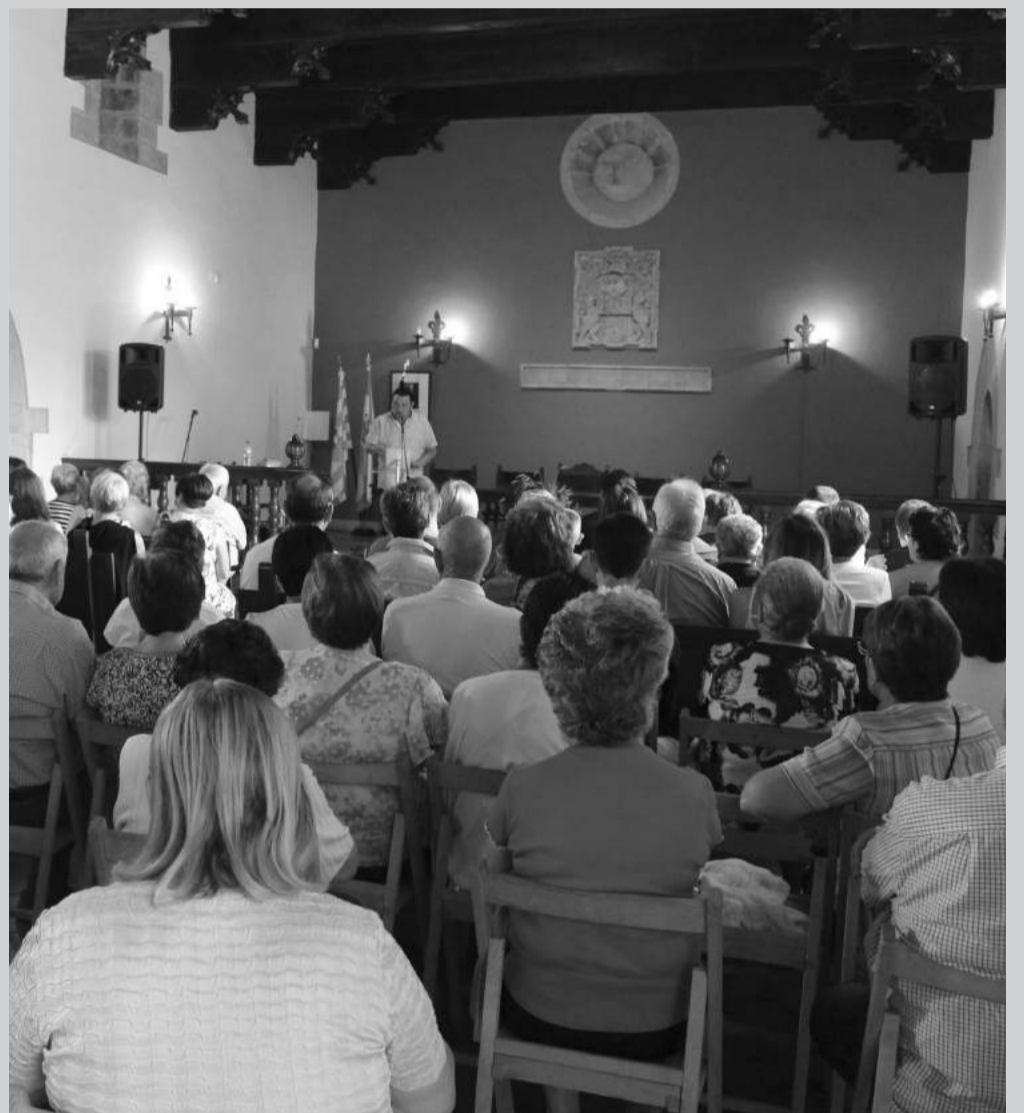
Numeroso público asistió a los actos conmemorativos.

EL EDIFICIO PREVISTO EN EL REBOLLAR CUENTA CON LA FINANCIACIÓN DE FONDOS FITE POR VALOR DE 166.225 EUROS