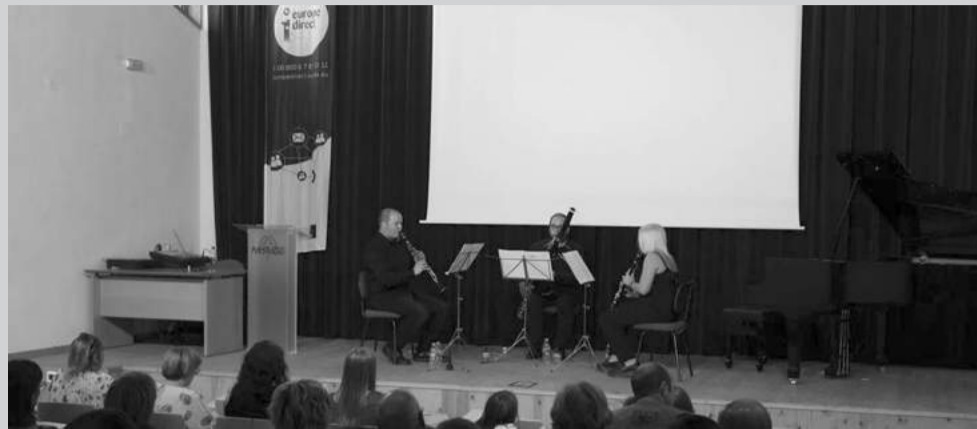
Actuación del trío "Donax" en el salón de actos de ADEMA.