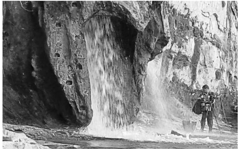
Chimenea del Nacimiento del Río Pitarque.