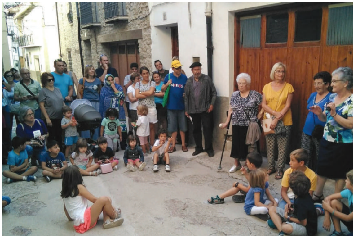
Encuentro intergeneracional donde los mayores contaron historias a los pequeños.

Cantavieja se convirtió, el primer sábado de septiembre, en un lugar de cuento. Con el nombre de "Cuenta-vieja", la asociación "Esboira" organizó diferentes actividades donde los cuentos se convirtieron en los protagonistas. Cuentacuentos, mercadillo de libros de segunda mano y taller de marca páginas con la colaboración de ATADI, y un paseo literario por los rincones de la localidad fueron algunas de estas actividades destinadas a "acercar la lectura a los vecinos de manera original".