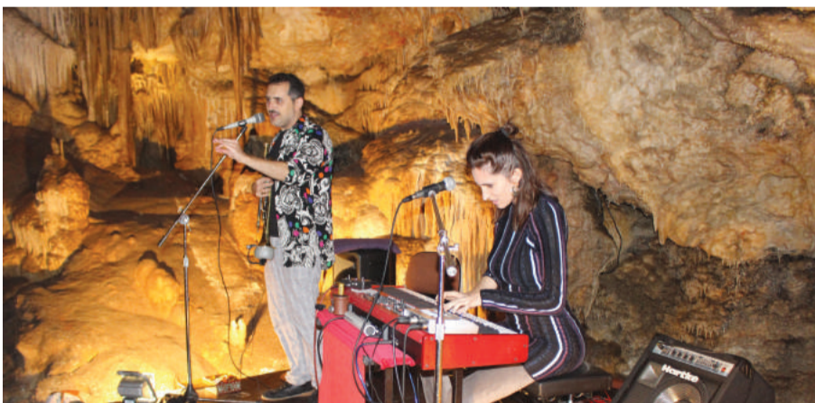
Actuación de "Versonautas" en el marco incomparable de las Grutas.

Una nueva edición del Ciclo de Música y palabra, con diecisiete años ya de andadura, volvió a llevar actuaciones de calidad a los escenarios propios de este evento en Molinos; las Grutas de Cristal, la iglesia y la sede de ADEMA.