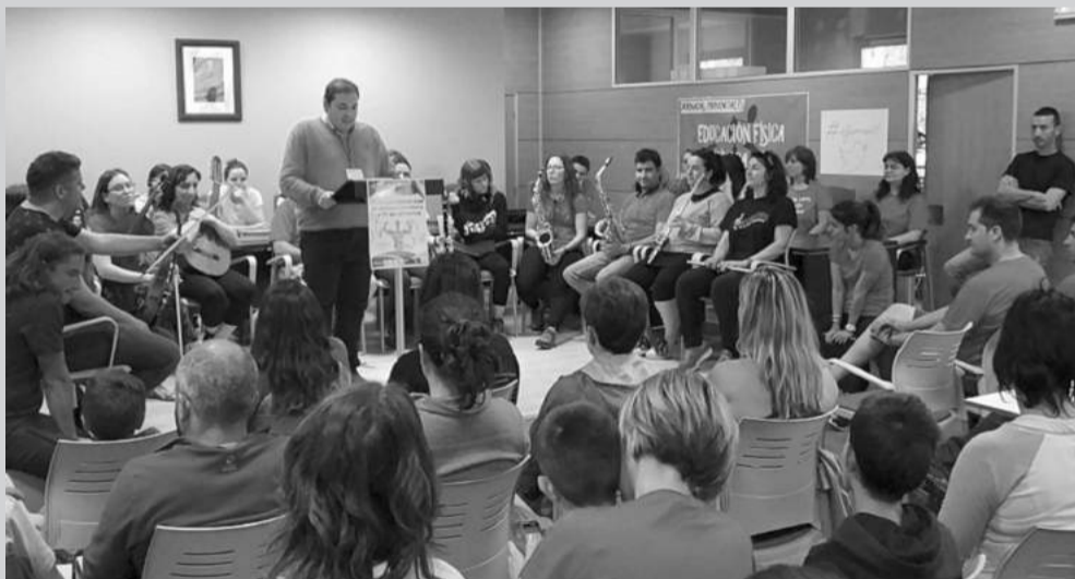
Jornadas de formación del profesorado en el municipio de Cantavieja.

El Centro de Innovación y Formación Educativa (CIFE) "Ángel Sanz Briz" de Teruel, fue el encargado de organizar las XIX Jornadas Provinciales de Educación Física y VI de Música, que tuvieron lugar en la localidad de Cantavieja los días 2 y 3 de junio de