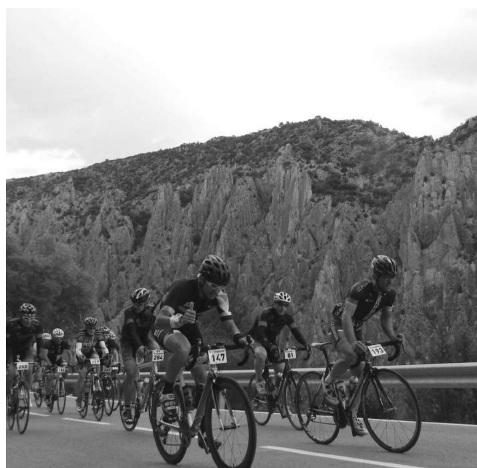
Los ciclistas ascendiendo por la carretera junto a los Órganos de Montoro.

El sábado 13 de mayo tuvo lugar la décima edición de la Marcha Cicloturista del Geoparque del Maestrazgo. La edición de este año contó con dos pruebas deportivas: