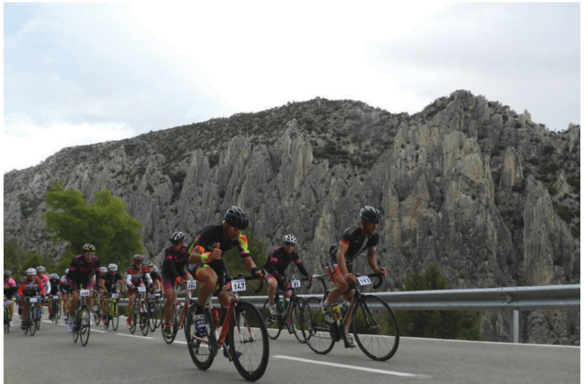
Paso de cicloturistas de La Gran Maestre por los Órganos de Montoro

Aquí estamos todos los pueblos, entidades e instituciones sin excepción para que día tras día el Maestrazgo sea destino turístico de primer nivel.