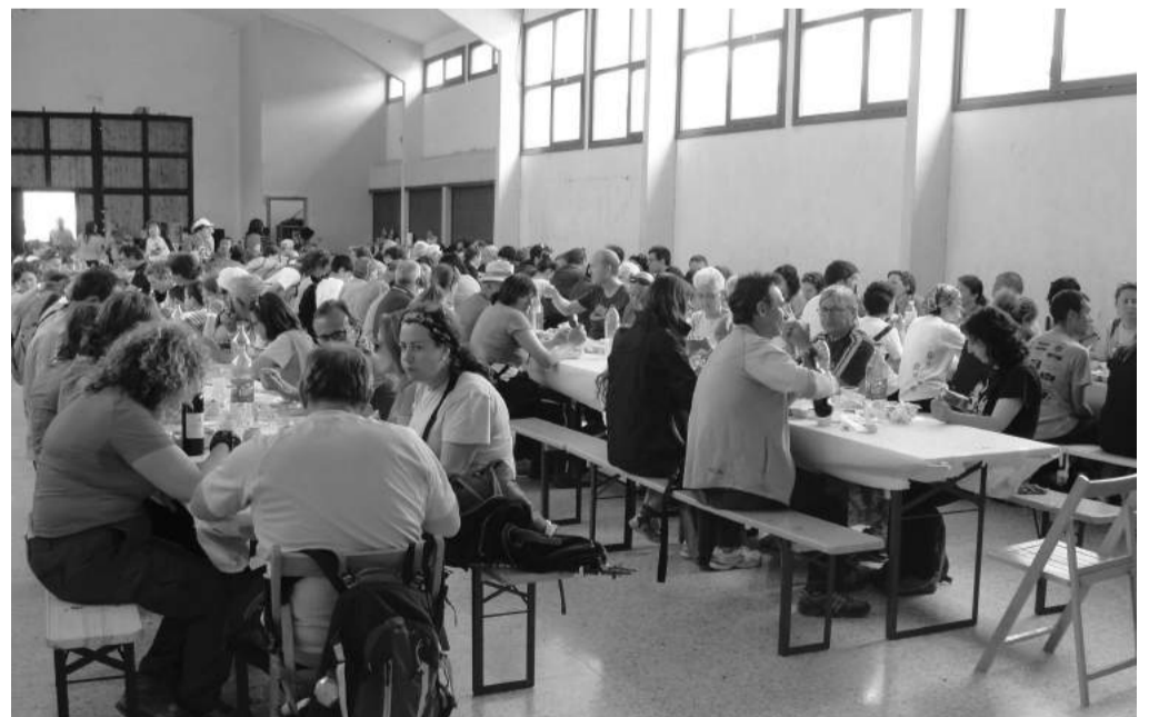
La comida popular congregó a numerosos participantes tras la marcha.