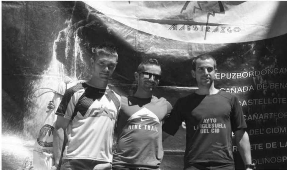
Podium de la Carrera de Montaña celebrada en La Iglesuela del Cid.

La Iglesuela del Cid celebró el 7 de mayo la undécima edición de la carrera por montaña del Maestrazgo.