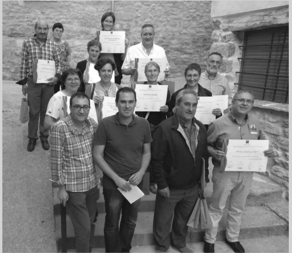
Foto de grupo de los distinguidos con la renovación SICTED y autoridades.

con su diploma. Entre los comercios, han obtenido su diploma SICTED La Bodega de Castellote; Panadería Elisa, de Villarroya de los Pinares; y la artesanía Villa-Rubei, también de Villarroya de los Pinares.