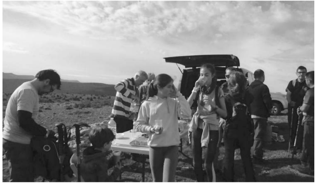
A pesar de las inclemencias del tiempo, participaron más de 50 personas.

La organización está contenta con el resultado de la jornada a pesar del desapacible día, ya que aunque los participantes, en su mayoría, aguantaron el tirón del agua.