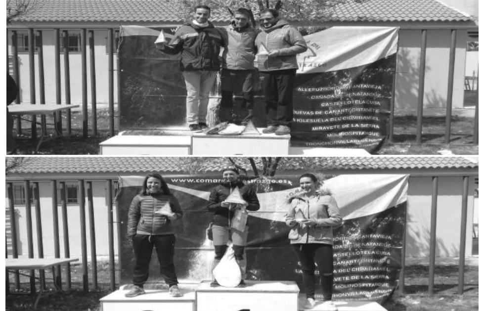
Podium masculino y femenino de Categoría Absoluta en el II Trail.

Villarroya de los Pinares se llenó el pasado 2 de abril de corredores y senderistas para la celebración de su II Trail por montaña. La organización cerró pocos días antes del evento las inscripciones al alcanzar el número máximo de plazas establecido en su reglamento, que está en 300 participantes, con el objetivo de mantener la seguridad y calidad de los servicios para todos los participantes.