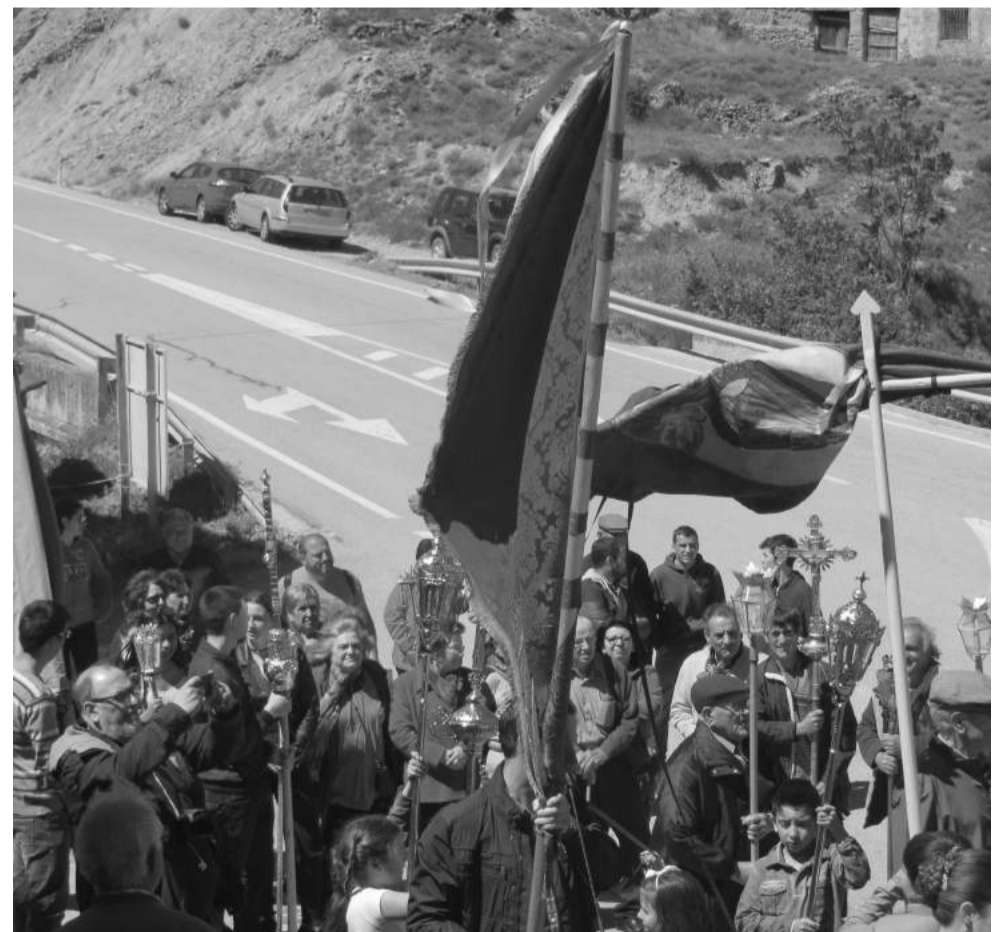
Bienvenida de la Fiesta de las Procesiones en Bordón al resto de municipios.