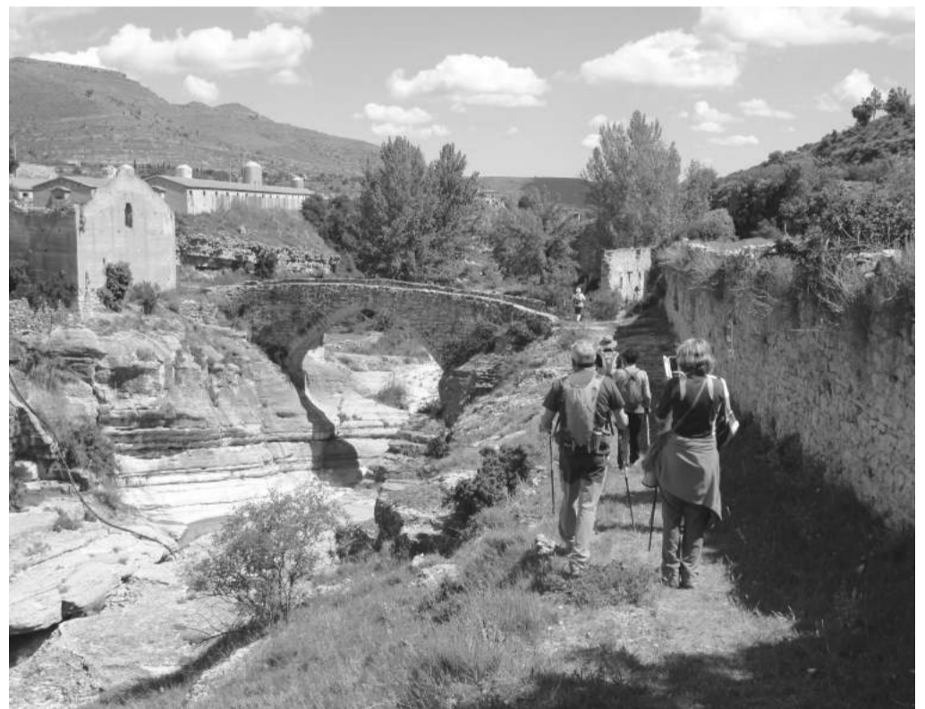
Llegada al entorno del puente y Molino Ronda en el término de Mirambel.

El ayuntamiento y los habitantes de Mirambel se volcaron en colaborar con el Servicio Comarcal de Deportes de la Comarca del Maestrazgo en la organización de este evento, ya muy asentado en el calendario anual de actividades. Alrededor de 50 voluntarios participaron en la preparación de los avituallamientos, en Protección Civil y en todo lo necesario para que los visitantes pasasen un buen día con organización y seguridad.