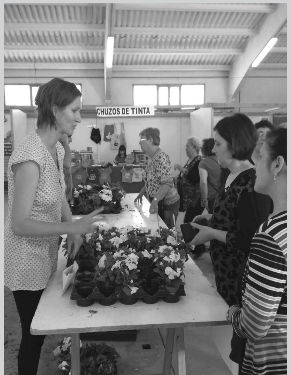
Venta de flores para embellecer los balcones de la localidad de Cantavieja.

Además durante ese fin de semana la localidad también participó en Rubielos de Mora en una muestra etnográfica que permitió dar a conocer un poco mejor los municipios pertenecientes a los Pueblos más bonitos de España y que fue muy bien acogida por turistas y vecinos. La muestra incluía la oferta turística, gastronómica y cultural de estos pueblos y contó con la participación de Morella, Valderrobres, Calaceite, Sos del Rey Católico, Puertomingalvo, Aínsa, Ansó, Cantavieja y Anento. Paralelamente, se realizó una reunión de los alcaldes y técnicos de turismo para plantear nuevas ideas para dinamizar esta red que cuenta con 57 socios en todo el país.