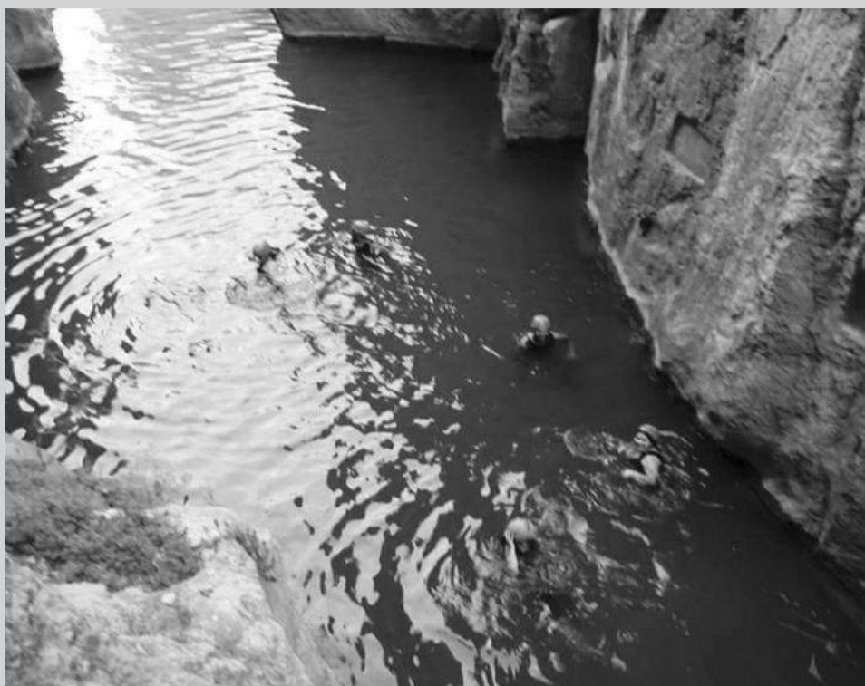
Trekking acuático en el Día del Geoparque de Montoro de Mezquita.

Durante la semana del 26 de mayo al 4 de junio el Geoparque del Maestrazgo celebró la XI semana Europea de los Geoparques.