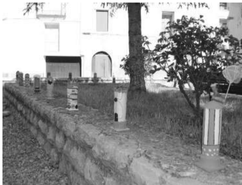
Pilonos decorados por los niños.