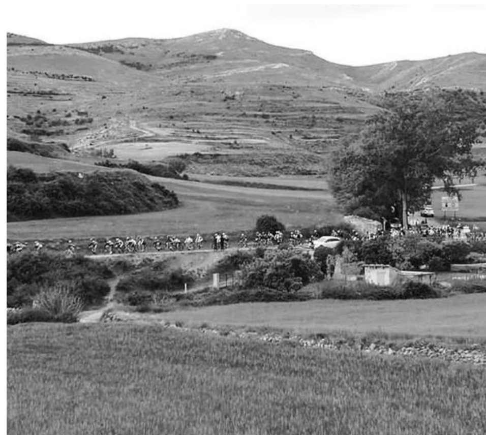
El pelotón de La Gran Maestre se unió a los ciclistas de La Maestre en Ejulve.

Por su parte, más de 115 ciclistas participaron en La Maestre, uniéndose con el pelotón de la Gran Maestre en el municipio de Ejulve.