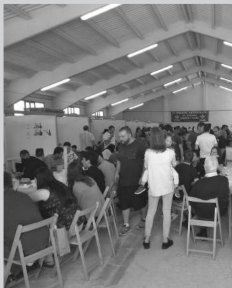
Mesón de la Tapa y la Cerveza.

Durante la mañana del sábado se pudo disfrutar en el recinto ferial, de las mejores tapas y raciones, ya que algunos de los establecimientos del municipio ofrecían manjares de lo más variado en el VI Mesón de la Tapa y la cerveza. Además los más pequeños pudieron disfrutar en el pabellón contiguo de varios castillos hinchables y un toro mecánico, con lo que el recinto estuvo hasta los topes toda la mañana. La tarde fue el momento de los amantes de los toros. Se inauguró la temporada taurina con un desafío de las ganaderías y con exhibición de recortadores, con mucha gente en la plaza y muy buenas vacas.