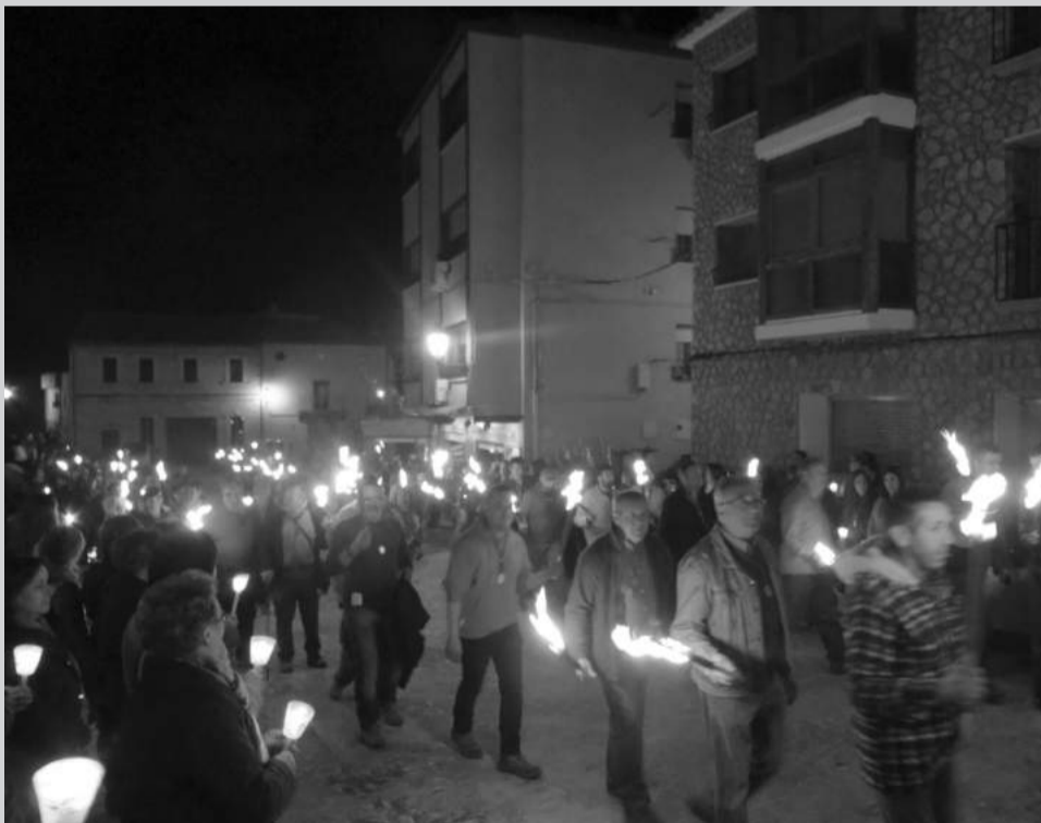
Llegada por la noche de la Romería del Llovedor.

La comida de hermandad tuvo lugar en el polideportivo y en la sobremesa se pudo disfrutar del toque de las guitarras, laúd y bandurria de cuatro músicos bordoneros que a modo de concierto improvisado pusieron el broche de oro a la comida. Continuando con la tradición, al terminar la comida la iglesia volvió a congregarse a autoridades y vecinos y desde allí las comitivas de los pueblos fueron saliendo ordenadamente. El primero en hacerlo fue Tronchón, después Bordón, a continuación Mirambel y para finalizar Olocau del Rey despidiéndose hasta el próximo año.