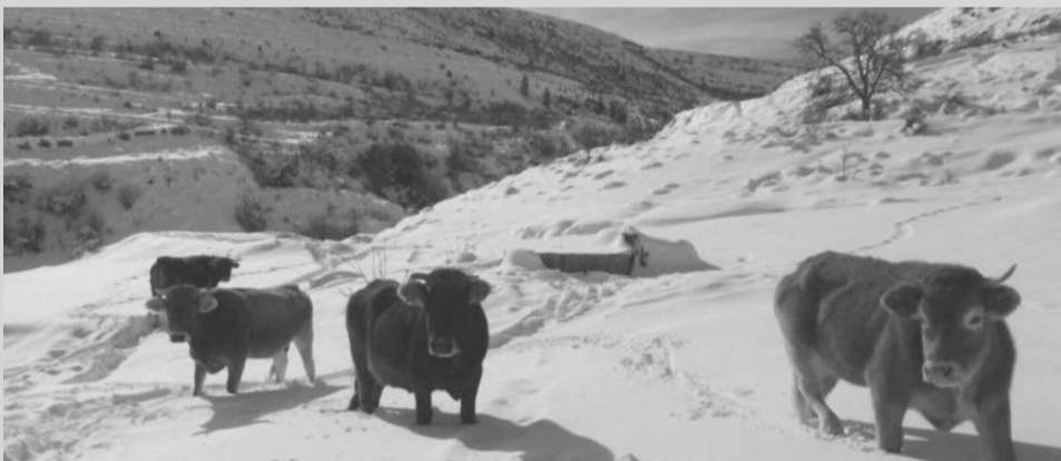
Ganadería de vacuno en Tronchón.