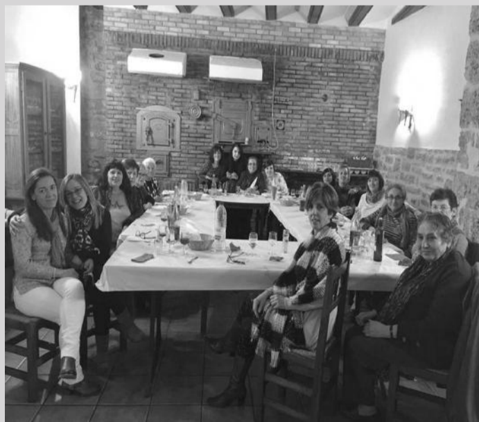
Grupo de mujeres en la cena de Bordón.

zada por la asociación de la localidad que lleva el nombre de la mártir. Acabado el ágape no faltó el tradicional bingo ni el sorteo de regalos para las asistentes. La sobremesa fue amenizada por un espectáculo de magia y humor a cargo del "Show de Carlos Madrid".