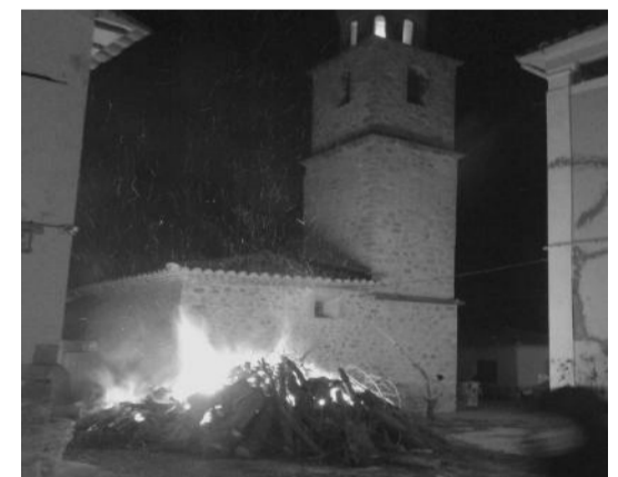
San Antonio en Abenfigo.