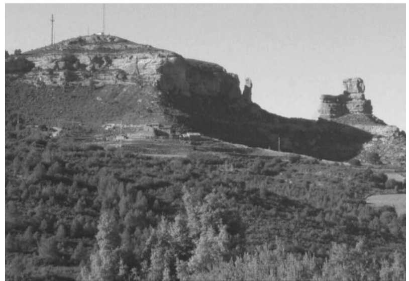
Imagen de la "polémica" con el Morrón de Bordón.

Afortunadamente todo se trató de una broma y los vecinos respiraron aliviados tras comprobar que el Morrón seguía intacto y conservaba su original fisonomía.