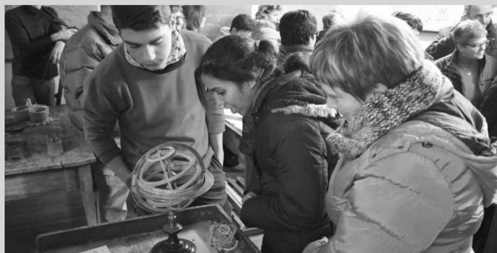
Los asistentes a la inauguración de la escuela observan la esfera armilar.

Fue un fin de semana muy animado en La Cuba ya que se hizo coincidir la inauguración de la escuela con la fiesta en honor a Santa Brígida. Los vecinos prendieron una gran hoguera, cenaron todos juntos y bailaron hasta tarde en el Trinquete.