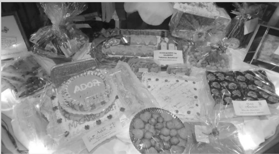
Productos ofrecidos para la subasta de San Macario en Castellote.

comenzaron a llevar sus ofrendas: pastas, tartas, dulces, empanadas y otros productos salados para que fueran subastados. La puja comenzó a las siete de la tarde, este año se adelantó el horario intentando favorecer la asistencia a la subasta de más gente. Al finalizar y al son de los gaiteros se subió a la ermita de San Macario para cantar las Albas. Al terminar la cena comenzaron los juegos tradicionales organizados por la asociación cultural Ador. Varios jóvenes se aventuraron a subir a lo alto del mayo para coger el conejo y el pollo y lo lograron. También hubo un turno para los más pequeños que no escatimaron esfuerzos en intentar tocar a los animales.