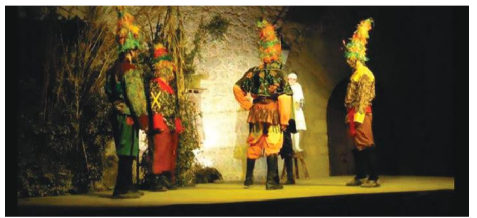
Los actos tendrán lugar el próximo sábado 25 de febrero.

La organización del Festival Aragón Negro en la localidad de Mirambel tuvo que suspender los actos previstos para los sábados 21 y 28 de enero a causa de la gran nevada que tuvo lugar en la zona. La nueva cita será el sábado 25 de febrero con actividades por la mañana y por la tarde.