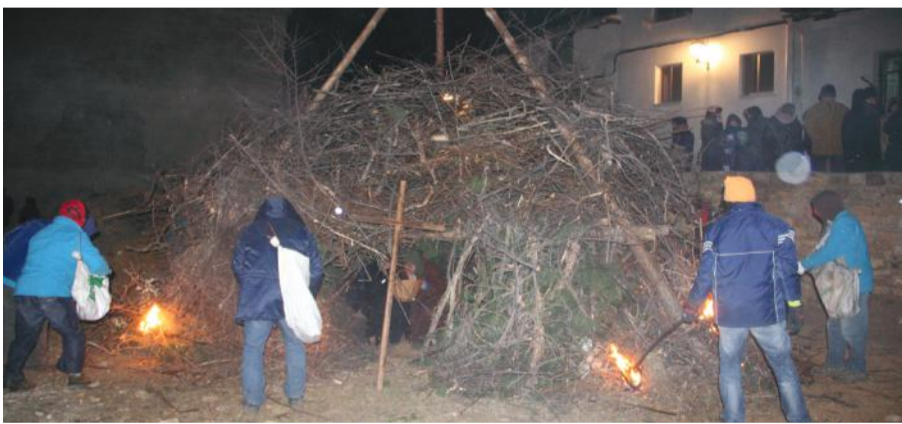
Quema de la hoguera de San Antonio en La Iglesuela del Cid.

Uno de los santos más venerados en nuestra comarca es San Antonio. Este año, a causa de las intensas nevadas, en algunos pueblos se ha visto trasladada su celebración a otros fines de semana, lo que no ha restado ni un ápice de entusiasmo a los habitantes ni a los visitantes.