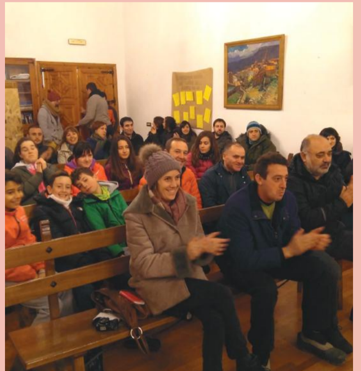
Público que se acercó al concierto en La Iglesuela.