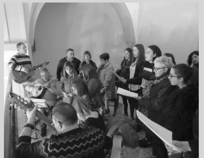
Misa baturra del grupo "Aires de la Atalaya" Castellote.

ESPACIO PUBLICITARIO PERIÓDICO MAESTRAZGO INFORMACIÓN