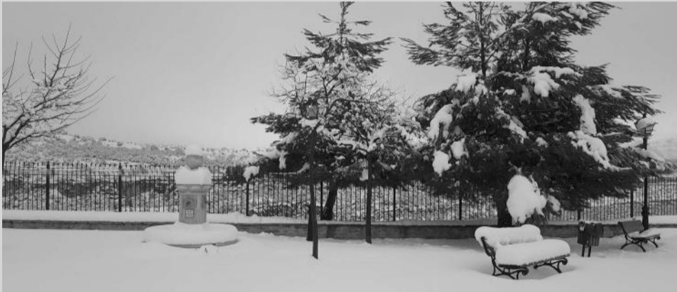
Villarluengo (Foto: Fondo Villarluengo).

Estas cuñas, de las que este año se financiarán hasta diez, se usarán para la limpieza de uno o varios municipios, pero el acuerdo contemplará que estén a disposición de la Diputación de Teruel si las necesita para llevar a cabo alguna actuación puntual.