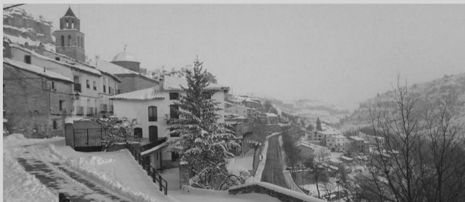
Nevada en Allepuz.