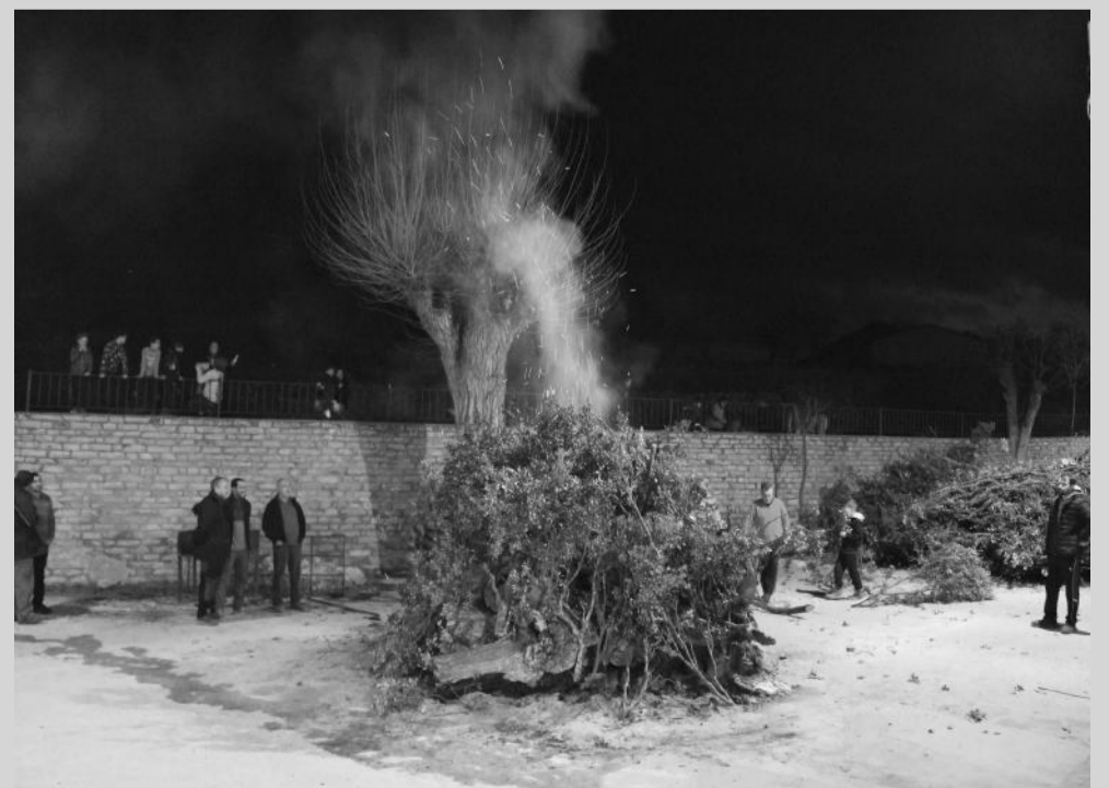
Encendido de la hoguera de Santa Brígida en el municipio de La Cuba.