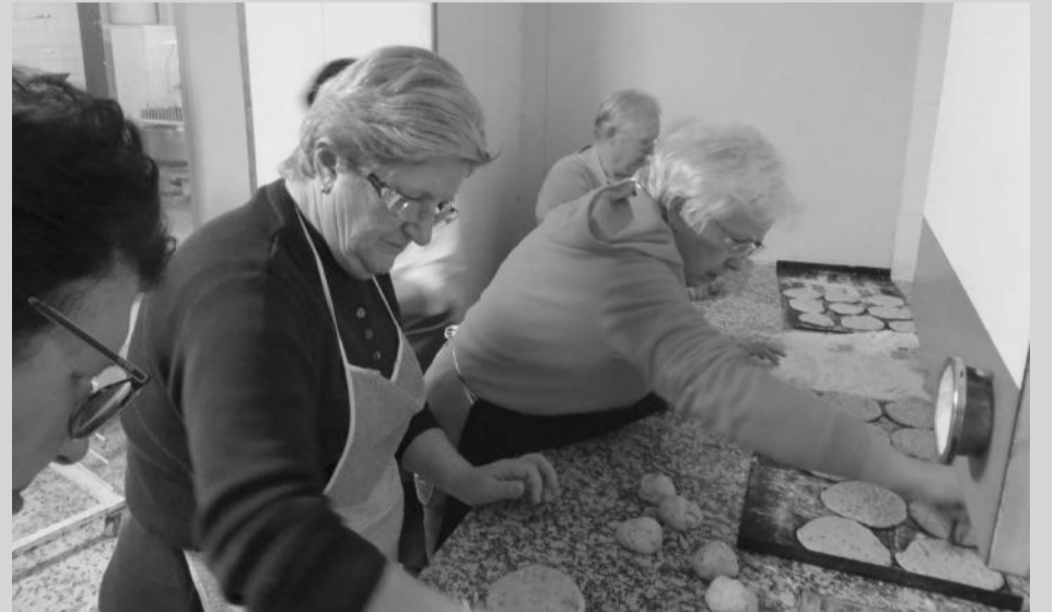
Dando forma a las tortas de San Blas de Cuevas de Cañart.

El domingo fue San Antonio el protagonista de la fiesta, al que se veneró convenientemente con misa a las doce y posterior procesión.