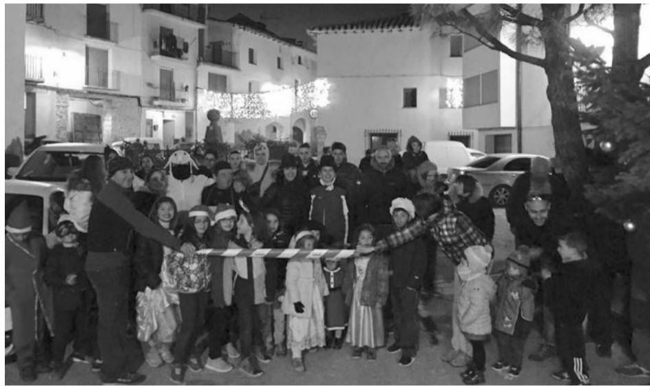
Salida en la Carrera de San Silvestre de Bordón.

Por tercer año consecutivo la localidad de Bordón celebró la carrera de San Silvestre para finalizar el año y comenzar con buen pie el 2017. El sábado 31 de diciembre una sucesión de corredores, de todas las edades, ataviados de los más diversos disfraces se disputaron los primeros puestos en el recorrido por las calles del