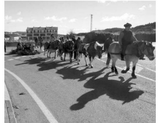
Arrastre de maleza en La Iglesuela.