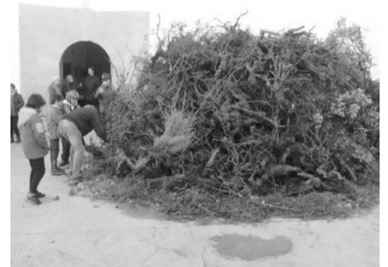
Hoguera de adultos en Las Planas.