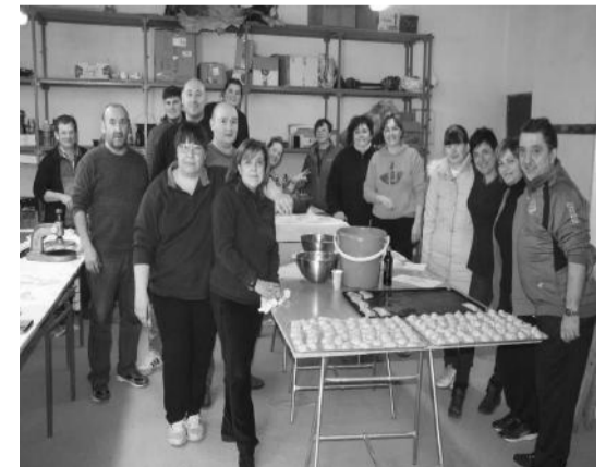
Pasteles mayores de La Iglesuela.