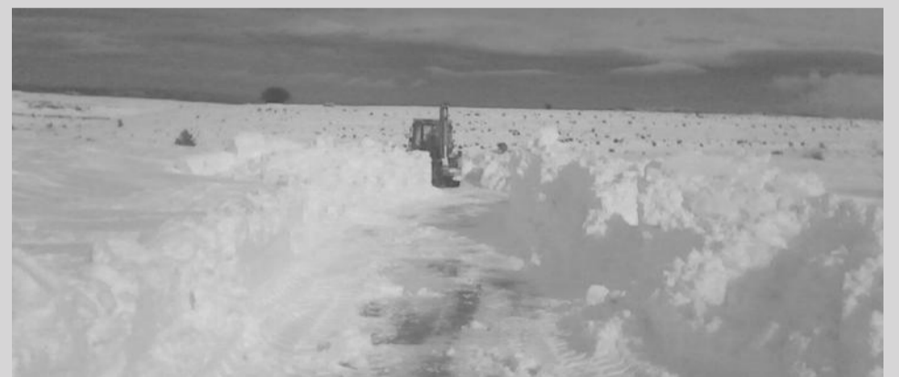
Carretera de Cantavieja a Tronchón.