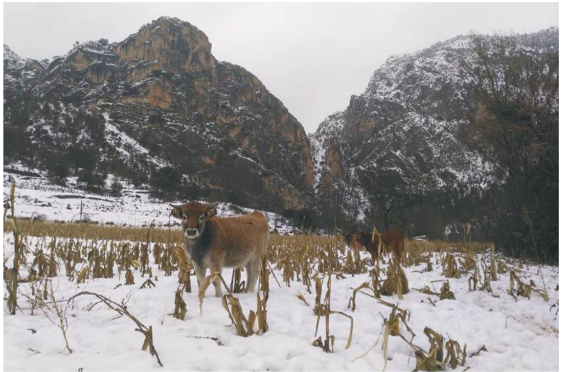
Instantánea de la nevada en Pitarque (Foto: La Fonda de Pitarque).

Los medios de apoyo no fueron los suficientes y se tardó más tiempo del conveniente en limpiar los accesos a masías y explotaciones ganaderas. Además hubo problemas de cortes de suministro eléctrico. La DPT se reunió con los alcaldes para mejorar los medios operativos en el futuro.