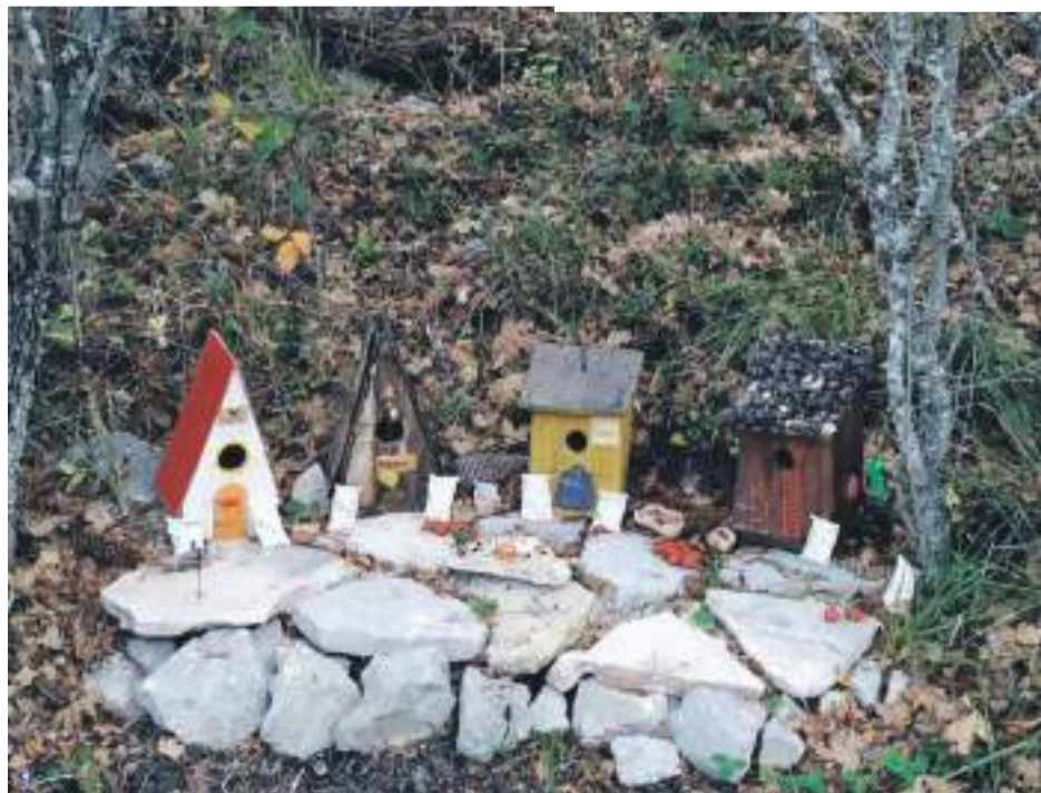
Algunas de las pequeñas casas de las hadas de Montoro de Mezquita

El bosque de hadas, que es de entrada libre y gratuita, es una excelente ocasión para disfrutar de una manera diferente de Montoro de Mezquita, siendo una oferta única en el Maestrazgo con la particularidad de que se ha realizado gracias a la iniciativa de los vecinos del pueblo.