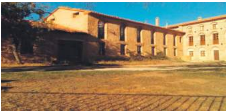
La Iglesuela del Cid primer centro de mayores vacunado

Los últimos días del año 2020 se despidieron con el comienzo de la campaña de vacunación contra el COVID-19 en la Comarca del Maestrazgo. Unos de los primeros vacunados los residentes del centro de mayores de La Iglesuela del Cid.