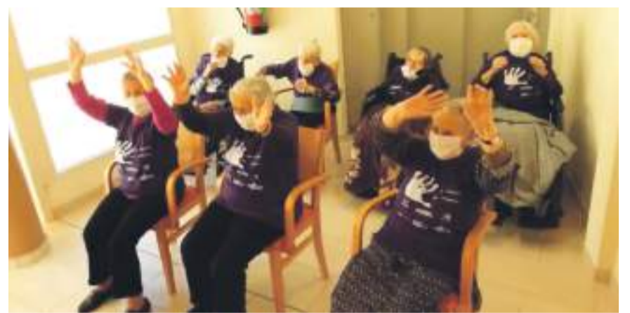
Usuaris de la residencia de Cantavieja

Deporte Maestrazgo incentivó la practiva de deporte en contra de la violencia de género el pasado 25 de Noviembre, cualquier actividad estaba permitida para visibilizar el rechazo.