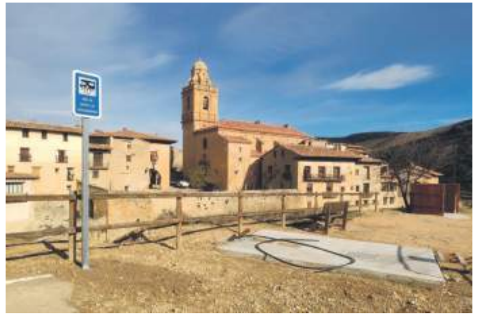
Mirambel, espacio destinado para autocaravanas

El Ayuntamiento de Mirambel lleva varias semanas inmerso en el proyecto de creación de una zona de parking para autocaravanas.