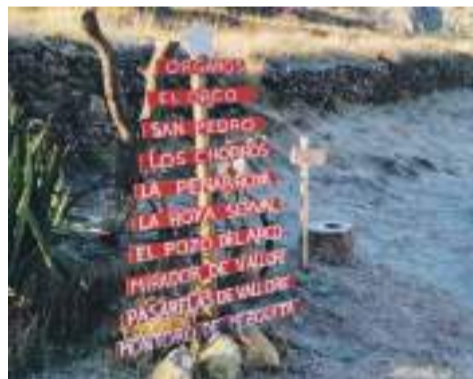
Montoro de Mezquita.