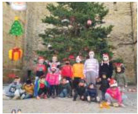
La Iglesuela del Cid.