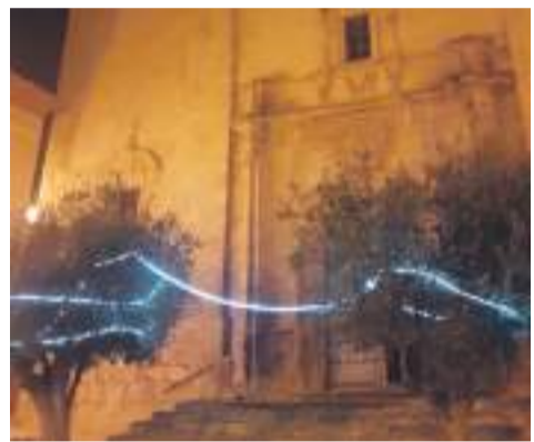
Cuevas de Cañart.