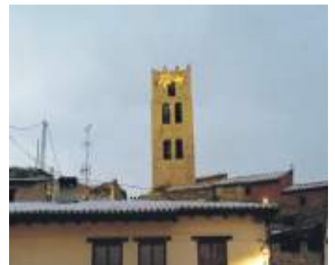
Villarroya de los Pinares

en que se encuentra la fuente de la plaza. Así mismo, los vecinos también han decorado uno de los árboles que rodean la Iglesia y dentro han puesto un Belén. El consistorio también ha ayudado instalando las luces por las calles principales.