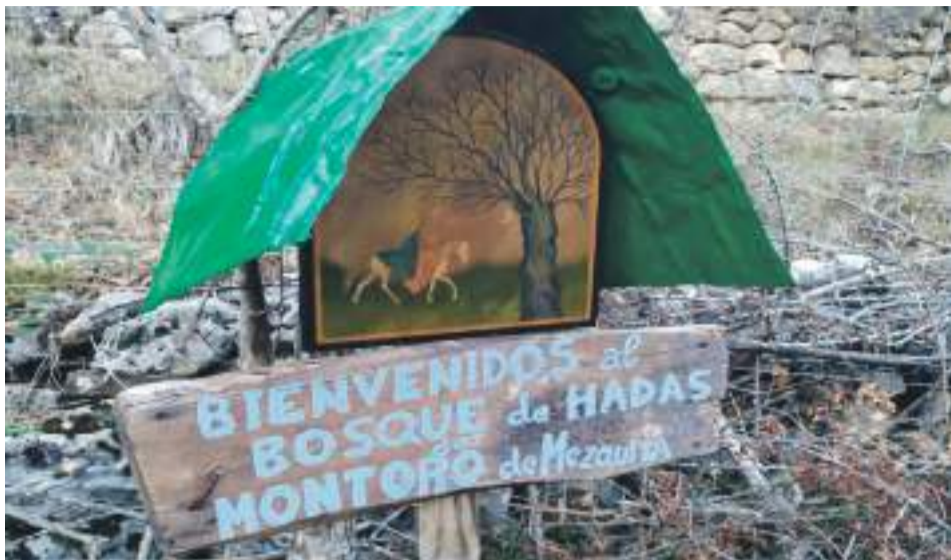
Bienvenida al Bosque de hadas de Montoro

El municipio de Montoro de Mezquita ha puesto en marcha este pasado verano un proyecto de lo más especial. Se trata del bosque de hadas ubicado a pocos metros del centro urbano y que, a día de hoy, han recorrido ya miles de personas.