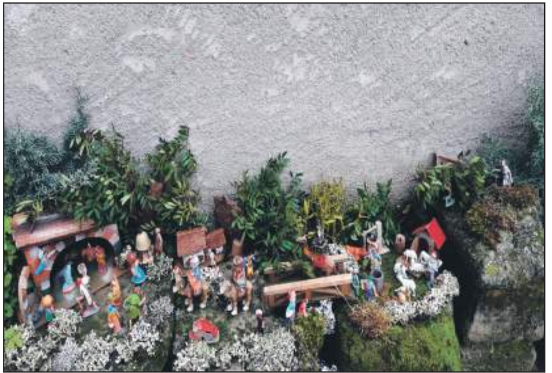
El Belén de Abenfigo un guiño a todos los pueblos del Maestrazgo.

Todos los pueblos han transmitido su deseo de ¡Feliz año nuevo!