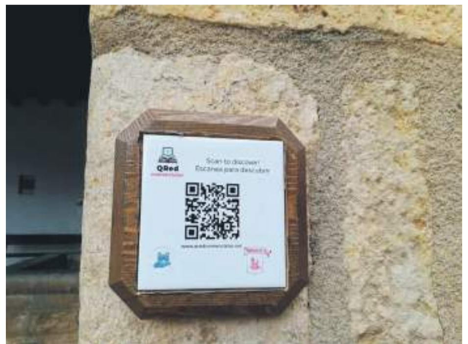
Información turística 24 horas en La Iglesuela del Cid.

Además, también se propone la realización de diversas rutas senderistas y recorridos por el pasado medieval, las fuentes y lavaderos o las construcciones de Piedra Seca