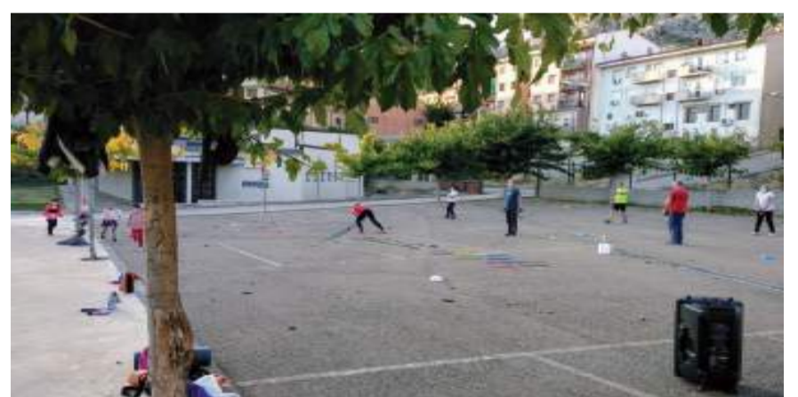
Actividades deportivas al aire libre

La Comarca del Maestrazgo da comienzo a las clases deportivas del curso 2020-2021, siguiendo los protocolos y recomendaciones sanitarias de la lucha frente al COVID-19.