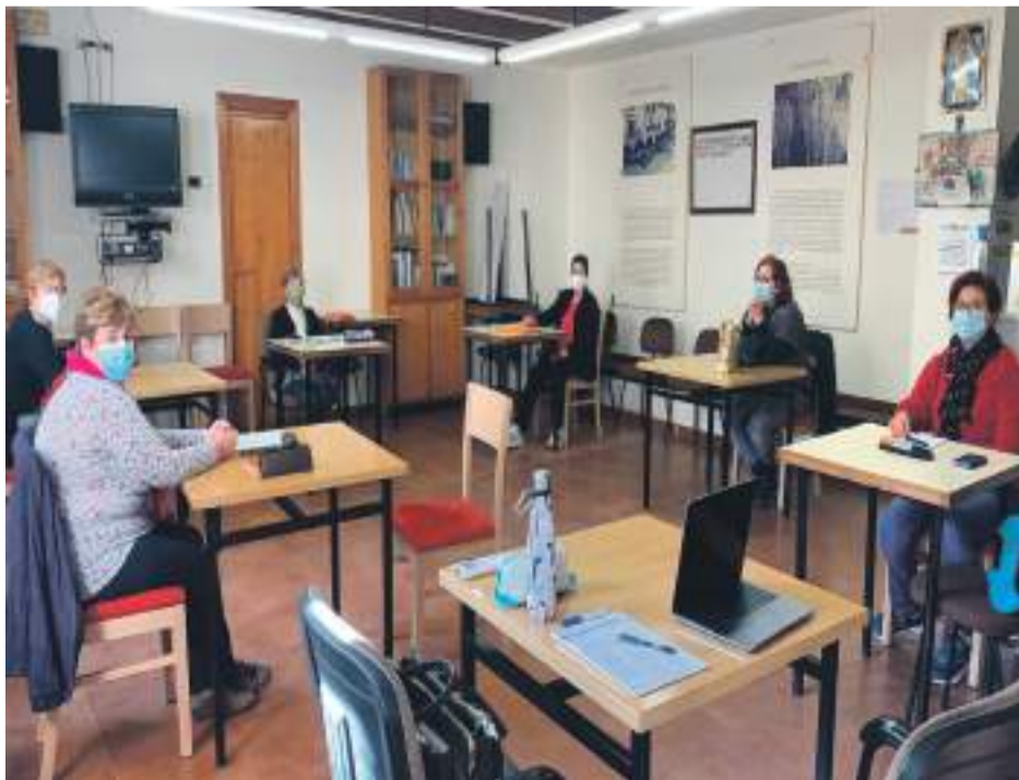
Alumnas del curso de informática en Molinos.

Por ello, se realiza en grupos reducidos, manteniendo la distancia social y todos los asistentes llevan mascarilla, para garantizar en todo momento la seguridad de los vecinos de Molinos.