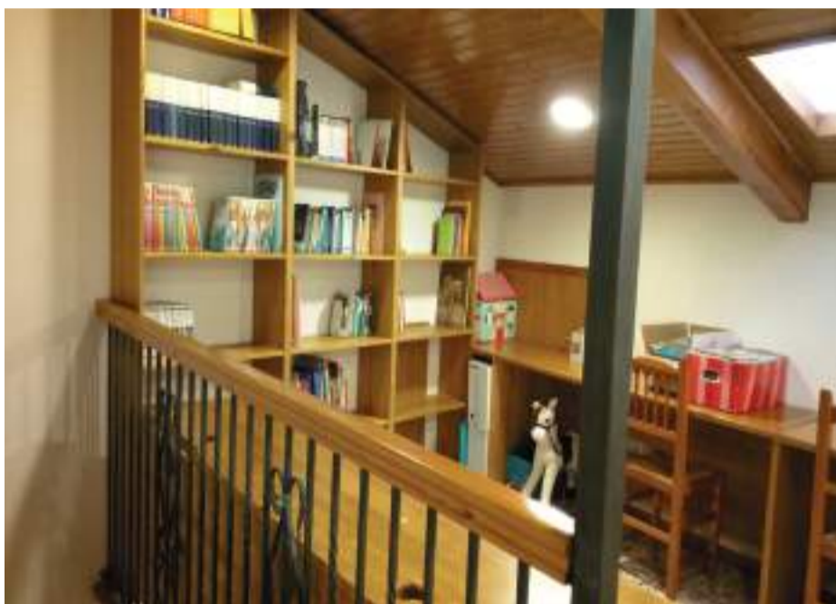
Sala biblioteca de La Cuba