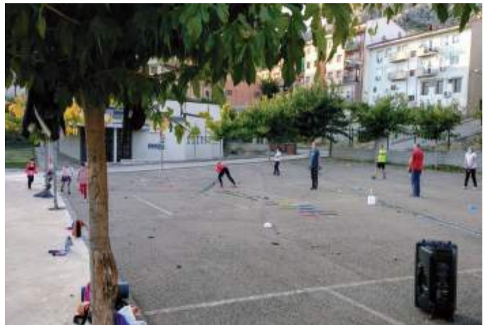
Actividades deportivas en Castellote.

LOS VECINOS DE ALLEPUZ DISFRUTAN DE UNA NUEVA PISTA DE PÁDEL CON ENTRADA LIBRE Y SIN CONTROL DE HORA-