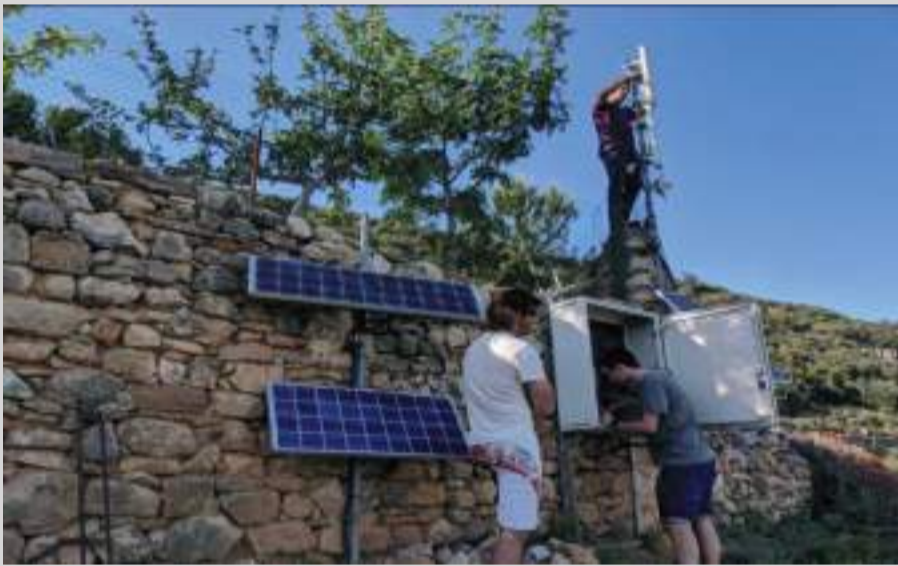
MIRAMBEL MEJORA ABASTECIMIENTO DE AGUA EXPLOTACIONES GANADERAS

La instalación ya está en marcha y se espera que esté lista para finales del 2020.