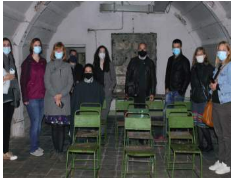
Socios europeos participantes en el proyecto Europa Creativa.

Desde la institución comarcial se valora muy positivamente la participación en este tipo de proyectos que sirven como intercambio de ideas entre diferentes territorios.