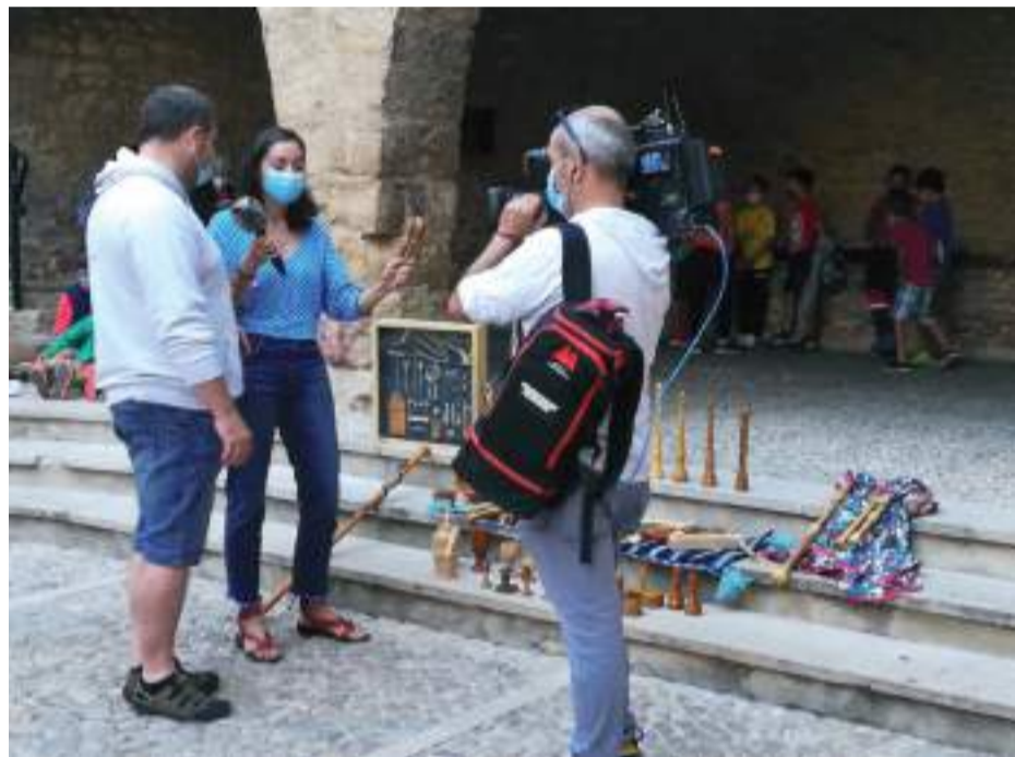
Vecino de La Iglesuela muestra instrumentos musicales a Aragón en Abierto.

El blog Historias de carreteras también hizo difusión sobre la arquitectura de La Iglesuela y el espectacular patrimonio de la piedra en seco, protegido por la UNESCO.