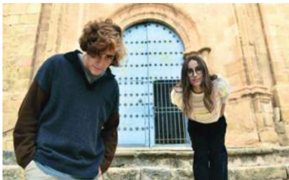
Zahara y guitarricadelafuente en Cuevas de Cañart.

El programa se emitirá próximamente en #0 de Movistar+.