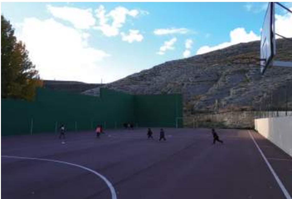
Actividades deportivas en Villarrojo de los Pinares.

Cantavieja, Castellote, Cuevas de Cañart, Fortanete, La Cuba, La Iglesia del Cid, Mirambel, Molinos, Pitarque, Tronchón, Villarrojo y Villarrojo de los Pinares ya pueden disfrutar así de la práctica de la actividad física, en un entorno seguro y siempre con monitores y monitoras profesionales del Servicio Comarcal de Deportes.