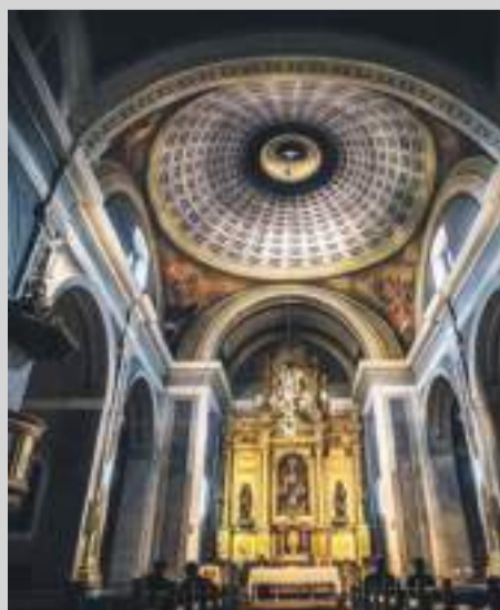
Primer premio fotografía

El calendario se distribuye de forma gratuita a todos los domicilios de la Comarca del Maestrazgo, para lo cual se editan 2000 ejemplares.