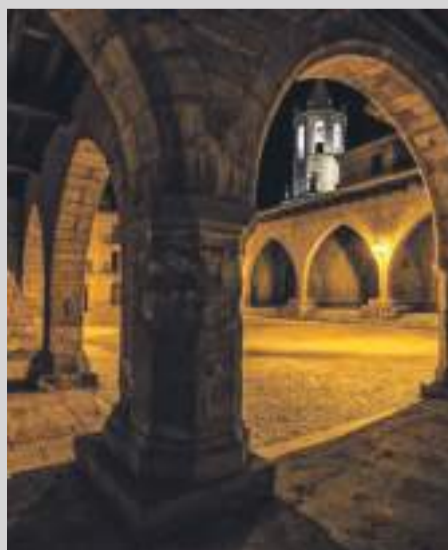
Segundo premio fotografía