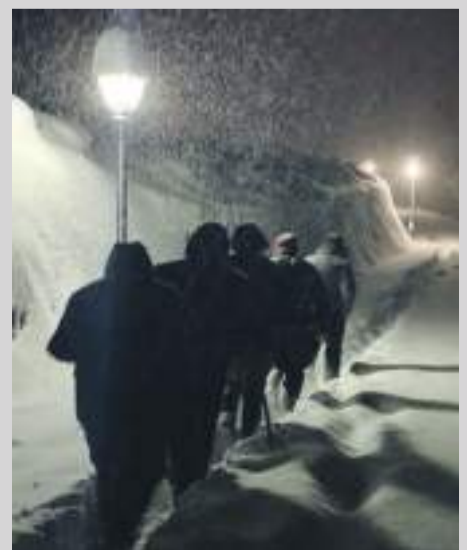
Tercer premio fotografía