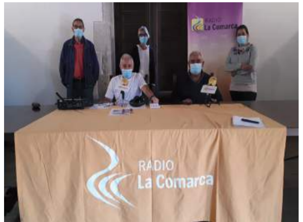
Radio La Comarca en Fortanete.

El programa se emitió en directo de 13h a 14h el miércoles 23 de septiembre y puede escucharse a través de la web www.lacomarca.net .