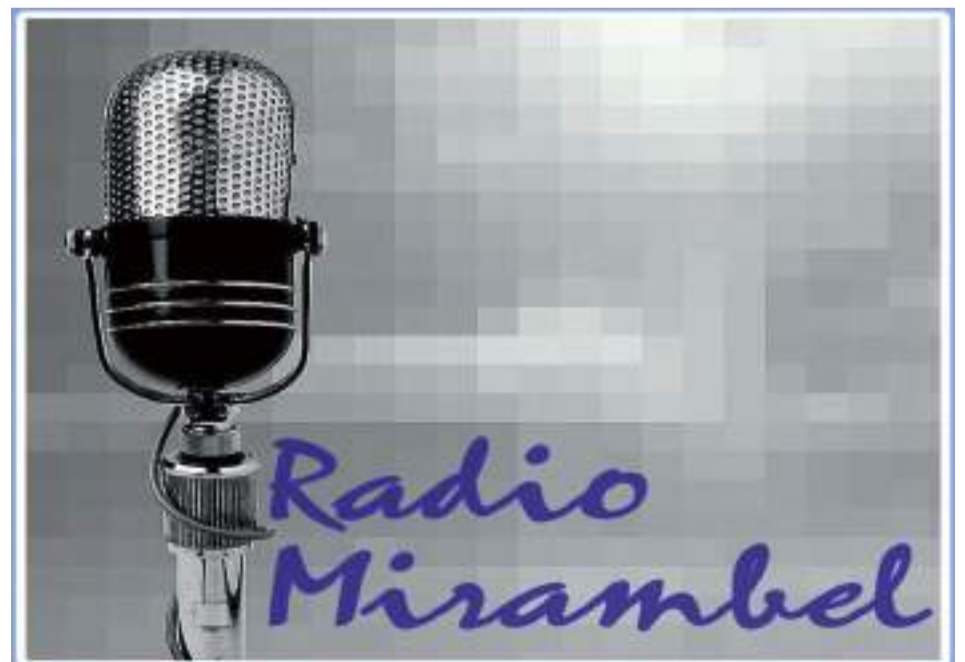
Nueva emisora de radio en Mirambel

Puede escucharse de lunes a viernes de 21h a 23h en www.radiomirambel.es .