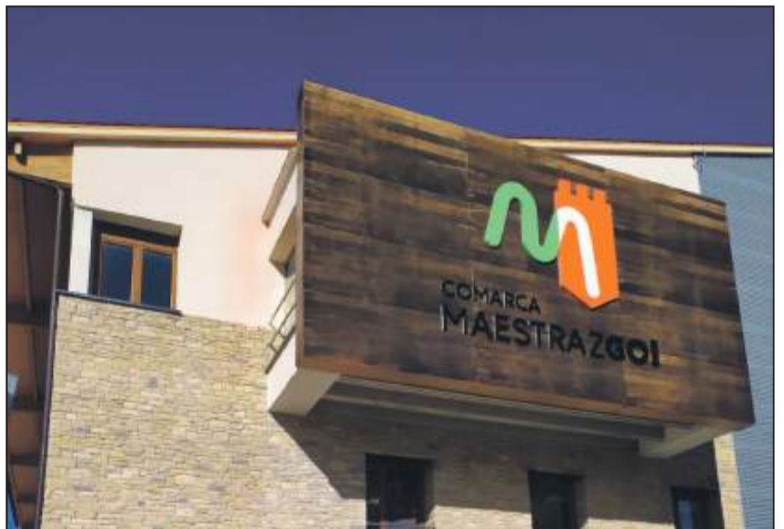
El edificio comarcals luce la nueva imagen corporativa en su fachada.

La Comarca se dirige a dos públicos diferentes. Por un lado, al interno, a los ciudadanos del Maestrazgo, y otra dirigida al público externo, al visitante. Esta nueva imagen cumple ambas funciones y muy pronto se podrá ver en todos los elementos comarcalses.