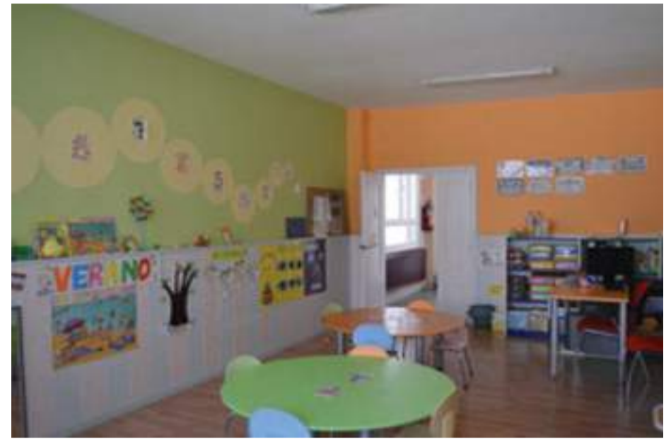
Escuela infantil de Cantavieja.

El Ayuntamiento de Cantavieja atiende las peticiones de las familias de los niños y niñas que asisten a la escuela infantil municipal.