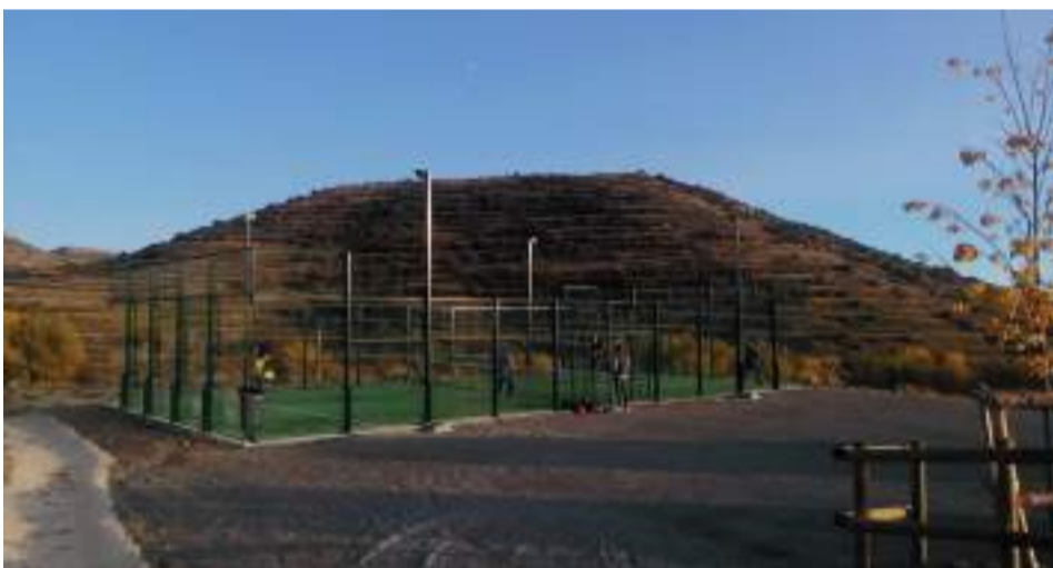
Nueva pista de Pádel en Allepuz, en el polideportivo Patxi Puñal.

Los vecinos de Allepuz han estrenado este otoño su nueva pista de pádel ubicada en el polideportivo Patxi Puñal.