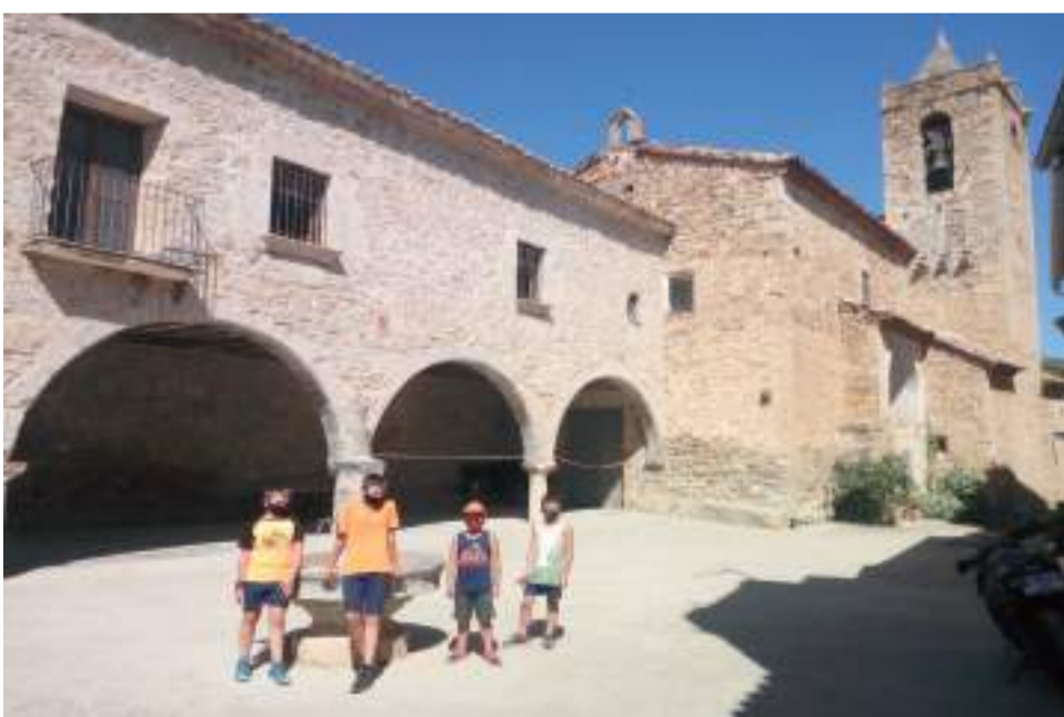
Equipo Topitropa ganadores del juego Orientraz-go!

Orientraz-go!, el juego de orientación para recorrer el territorio del Maestrazgo, finalizó el pasado 15 de septiembre. Tras recopilar todos los datos y fotografías necesarias, el área de Deportes de la Comarca del Maestrazgo, impulsora de esta iniciativa, ha dado a conocer los resultados a través de las redes sociales.